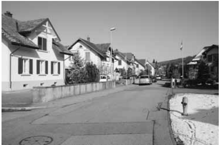
Kanalisationssanierungen Kirchenfeldstrasse (Bild) und Frybacherstrasse sollen rund 210'000 Franken kosten.

Die Nettoinvestitionen im Finanzplan betragen in den Jahren 2009 bis 2013 rund 4,6 Millionen. Diese Zahlen zeigen natürlich bloss einen Trend auf. Einerseits können unvorhergesehene Investitionen nötig werden, andererseits verschieben sich grosse «Brocken» oft um Jahre. Als Folge von Steuerausfällen und Kostenentwicklungen sinkt der erwartete Cashflow gegenüber der Vergangenheit. Er bleibt aber mit rund sechs