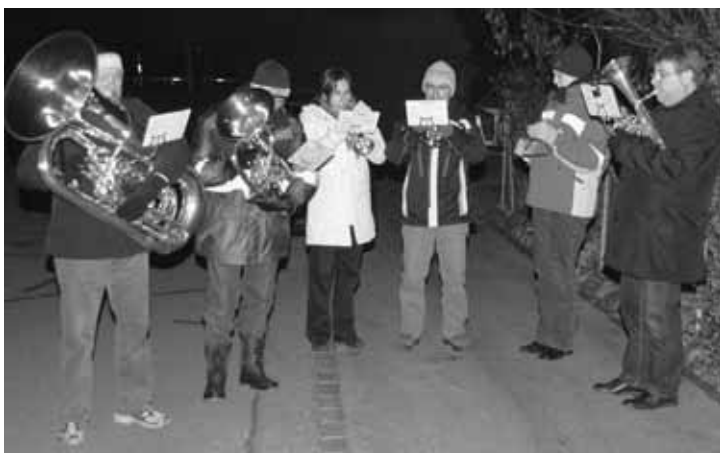
Weihnachtsstrassenmusik: Warme Klänge in bissiger Kälte.