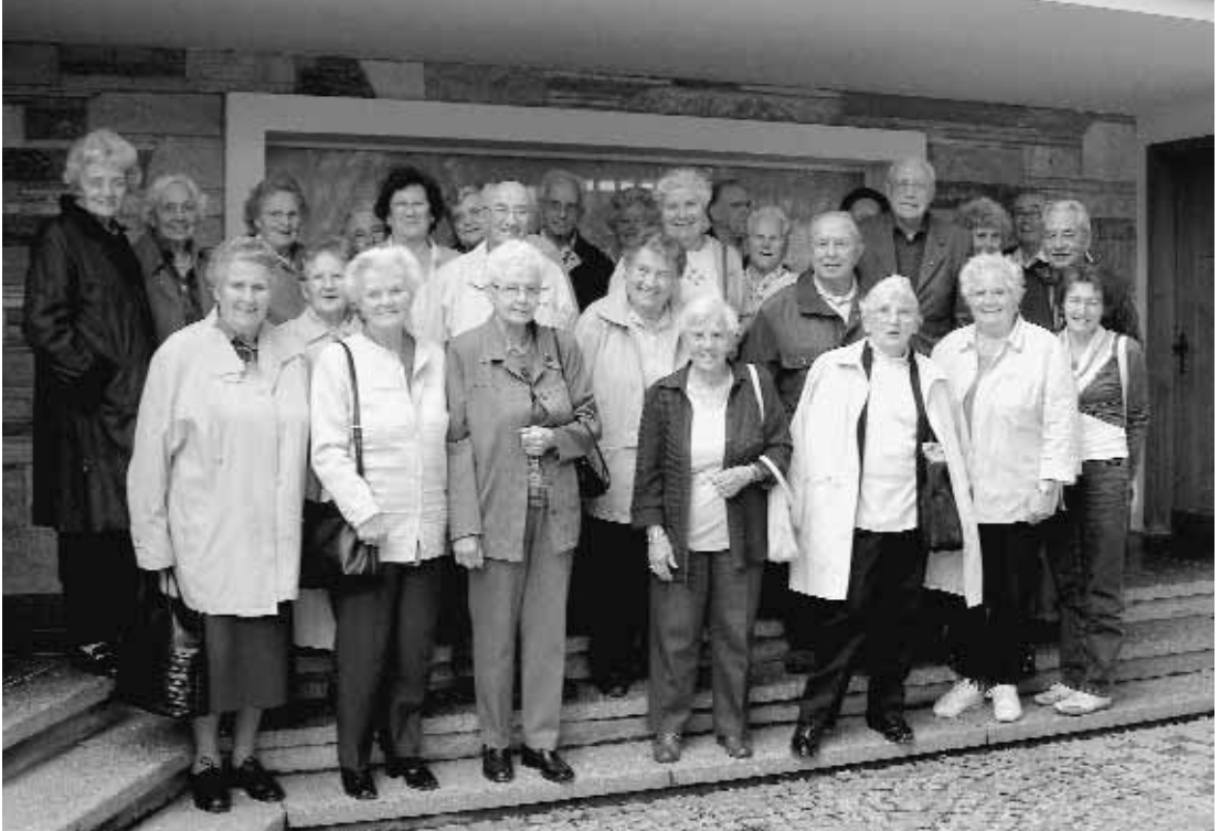
Die Senioren-Turngruppe anlässlich der Reise vom Frühling.

Wie immer in der Adventszeit traf sich die Senioren-Turngruppe zu einer kleinen Feier und einem feinen Essen im Restaurant Jura-blick. Diesmal war es am Mittwochnachmittag, 12. Dezember. Es waren auch einige Ehemalige eingeladen, die vorab aus gesundheitlichen Gründen nicht mehr aktiv mitturnen oder mitmachen können. Vor dem Essen wurde die Zeit für rege Gespräche genutzt. Man hat sich ja immer so viel zu erzählen. Dazwischen wur-