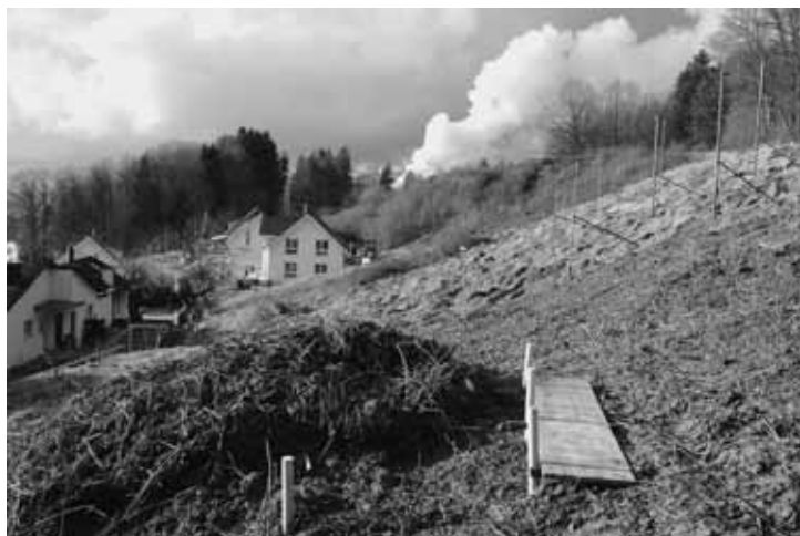
Die neue Wasserleitung verläuft unterhalb der geplanten Terrassenhäuser (Bauprofile rechts im Bild).

Die vom Gemeinderat eingesetzte Arbeitsgruppe Gemeindeorganisation unterbreitete dem Rat eine erste Serie von Anträgen zu Gebieten, welche sie in sei-