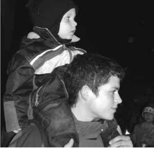
Da fühl ich mich sicher.