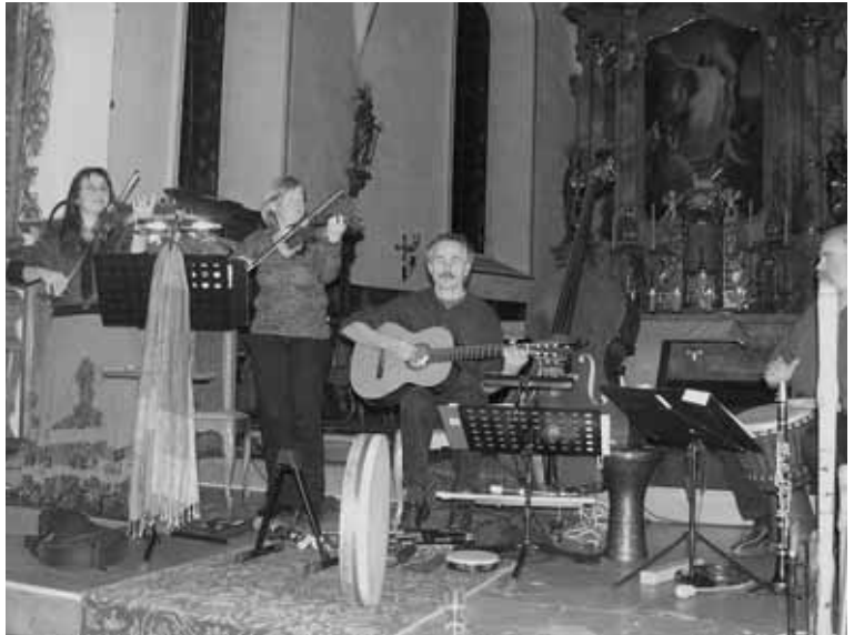
Musikerinnen und Musiker von «in flagranti» ...

Auf Einladung der ökumenischen Arbeitsgruppe «Gemeinsam unterwegs» trafen sich Liebhaber spezieller Musik am 23. November um 20.15 Uhr in der Kirche. Die Musikgruppe «in flagranti», drei Musikerinnen und zwei Musiker aus dem oberen Kantonsteil, gaben auf zum Teil wenig bekannten Instrumenten ein spezielles Konzert. Mit Geige, Akkordeon, Flöten, Gitarre, Mandoline, Kontrabass, einer Reihe von Perkussionsinstrumenten und Gesang unterhielt die Gruppe die Anwesenden auf das Trefflichste mit Musik aus dem keltischen, ost- und mitteleuropäischen Raum sowie mit einfühlsam vorgetragenen Eigenkompositionen. Die Zuhörerinnen und Zuhörer dankten den Interpreten mit einem langanhaltenden Applaus, was diese wiederum mit einer vom Publikum erhofften Zugabe quittierten. Im Anschluss an das Konzert schenkten die Organisierenden warme Getränke aus, was für einen gemütlichen Ausklang des interessanten Anlasses sorgte.