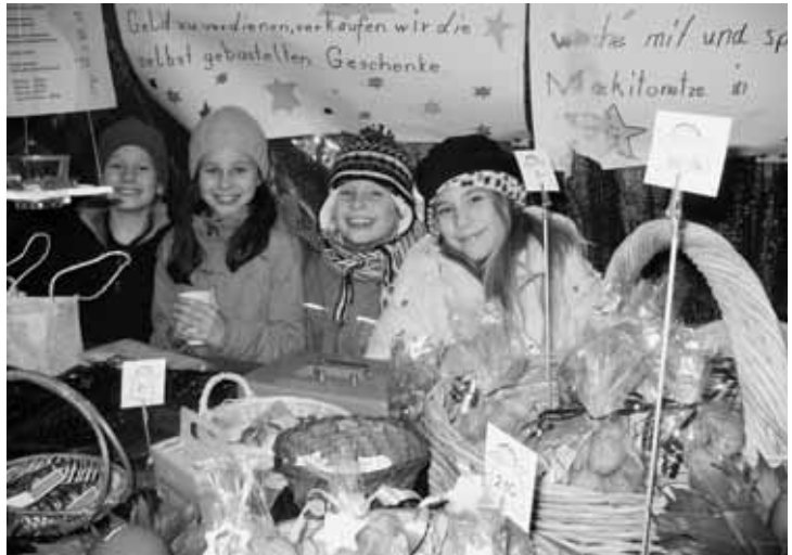
Wer kann diesem Verkaufspersonal widerstehen?