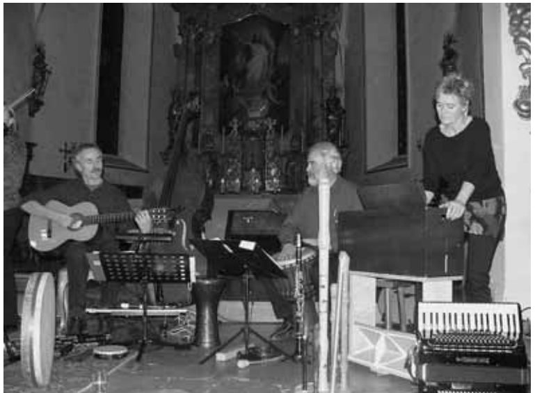
... beim Musizieren in der Gretzenbacher Kirche.