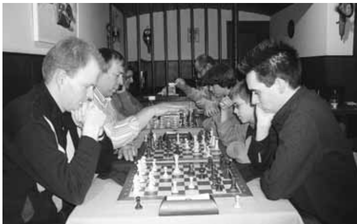
Schachspieler jeden Alters messen sich im Königsspiel.

Wissen Sie, welches die meist verbreitete Sportart in der Schweiz ist? Nun ja, wer auf Fussball tippt, hat nicht ganz unrecht, aber wussten Sie auch, dass ungefähr gleich viele Menschen in der Schweiz die Schachregeln beherrschen und auch diesem Spiel frönen? Natürlich kann man einwenden, dies lasse sich so nicht vergleichen. Doch meiner Meinung nach besteht der Hauptunterschied lediglich darin, dass Schach jeder für sich spielen kann, zu Hause im dunklen Kämmerlein, im Internet, mit einem Kollegen in der Mittagspause oder ganz ungezwungen in einem Schachcafé. All diese Spieler haben aber etwas gemeinsam: Sie üben ihr Hobby jenseits aller Vereinszugehörigkeit aus und erscheinen daher in keiner Verbandsstatistik.