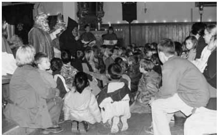
Das ist eine spannende Geschichte.