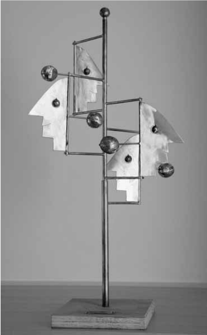
Paul-Gugelmann-Modell für den Kreisel.

und den Einsatz des geäußerten Vermögens. Effektive Defizite der Spitex sind ohnehin durch die Einwohnergemeinden zu übernehmen. Sollten