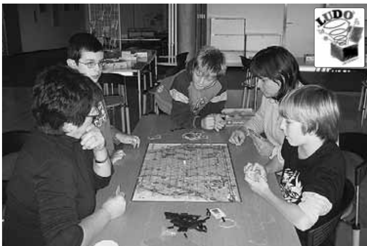
Konzentriert und fasziniert.