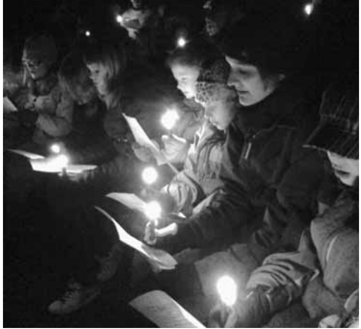
Stimmungsbild im Wald.

Die traditionelle Waldweihnacht der Cevianer war dem Thema «verloren» gewidmet. Bei winterlichen aber dennoch erträglichen Temperaturen traf sich eine grosse Schar von Eltern der Cevianer. Eine selbsternannte Eventorganisation machte den Besuchern eine Weihnacht der anderen Art schmackhaft. Man gab sich die Hände und sollte sich spüren, wobei sich gleichzeitig ein «Medium» in Form einer mit Tüchern verkleideten Frau durch die Besucher schwebte. Dies alles sollte Weihnacht bedeuten. Die Begründung für diese Art von Fest lautete, man habe keine Finanzen und daher keine Möglichkeit, eine traditionelle Weihnachtsfeier durchzuführen. Kurze Zeit später wurde die Handlung von einem Cevileiter abgebrochen mit der Meinung, man finde sicher etwas Unterstützung für ein Weihnachtsfest. Also machte sich die grosse Gruppe auf, um Unterstützung für das Fest zu finden. Im Täli war bereits der erste Posten, der eine Dorfgemeinschaft darstellte. Das Dorf hatte auch das Rezept für das Weihnachtsessen verloren. Die ganze Gruppe schwärmte aus und fand die verschiedenen Puzzleteile des Rezepts in der näheren Umgebung. Die erste Aufgabe war also erledigt. Der nächste Treffpunkt war der «Täfelibaum». Hier fand ein Wettbewerb im Schoggiessen statt. Quer durchs Dorf führte der