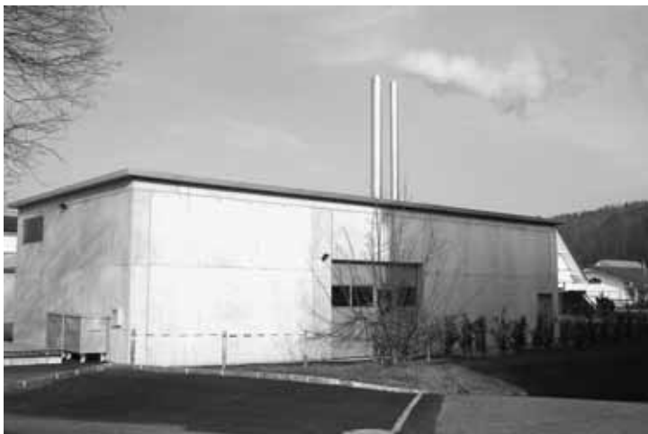
Energiezentrale in Betrieb.

Seit dem Anfeuertest im September ist die Holzsnitzelfeuerung im Dauerbetrieb und beheizt die angeschlossenen Gebäude. Im ersten Betriebsjahr gilt es nun, mit der Anlage Erfahrungen zu sammeln. Die Steuerung der Brennzei-