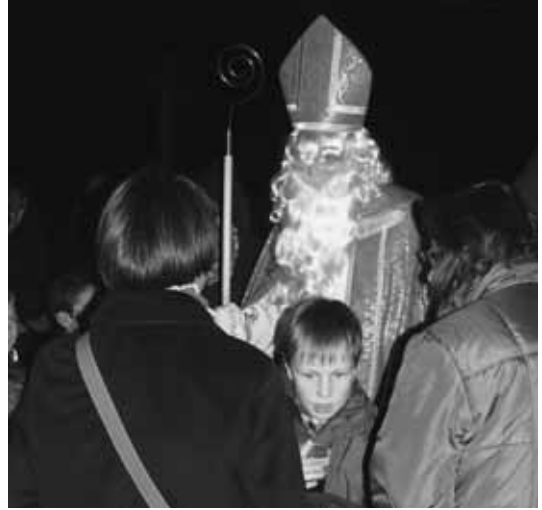
Ich gehe lieber auf Distanz.

In warme Kleider gehüllt trafen sich Eltern und Kinder zum traditionellen Klausaussenden in der Kirche Gretzenbach. Beim Auftritt des Samichlaus mit seinen Getreuen verstummte das muntere Geplauder der anwesenden Kinder. Mit grossen Augen folgten sie dem prächtig gekleideten, bärtigen Mann. Was wird er ihnen heute erzählen? Der Chlaus rief alle Kinder auf, ganz vorne in der Kirche Platz zu nehmen. Den Schmutzli bat er, die allezeit Folgsamen mit einer Geschichte auf die kommende festliche Zeit einzustimmen. Nach dem feierlichen Anlass versammelten sich alle auf dem Vorplatz, wo die Knirpse dem Samichlaus ihre Versli aufsagten. Zum Dank erhielten sie vom Samichlaus ein Lob und vom