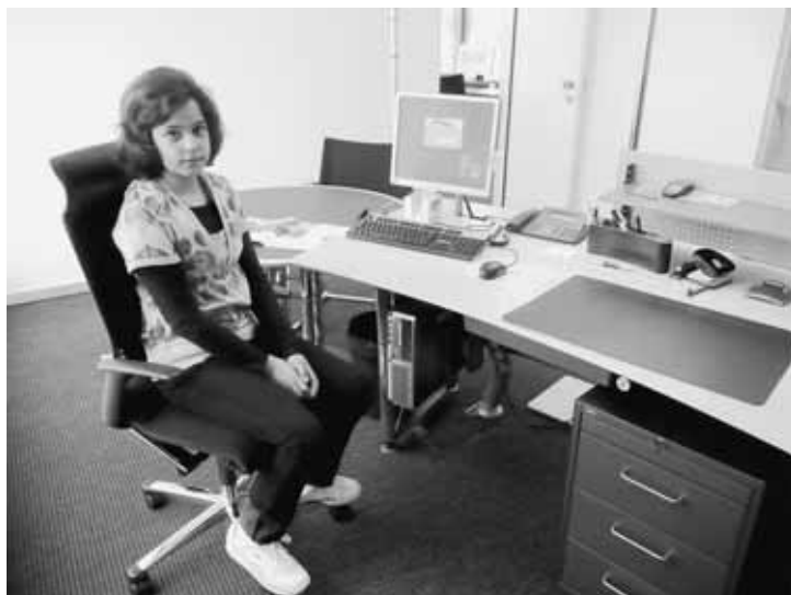
Ich fühle mich so erwachsen.

es feine Weggli und Nussgipfeli vom Bäcker. Mit der Münzmaschine war ich fast den ganzen Tag beschäftigt. Ich musste immer oben die leeren Münzrollen einlegen und auf die Starttaste drücken. Es wurden immer 50 Stück abgefüllt. Jede Münzsorte hatte eine andere Rollenfarbe. Die Einfränkler hatten eine grüne Tüte und die Fünffränkler eine Graue. Am Ende mussten ich und mein Vater alle Rollen zusammenrechnen. Endlich durfte ich eine echte Tausendernote anschauen und in der Hand halten. Um 12.00 Uhr gingen wir nach Hause zum Mittagessen. Am Nachmittag fuhren wir zuerst in die Bank nach Erlinsbach. Mein Vater musste dort viele Sachen abholen. Am Schalter in Küttigen hatte es viele Kunden. Eine Frau berichtete, dass auf der Strasse eben einen Unfall mit einem Kind und einem