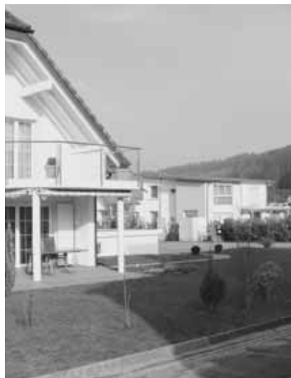
Ein Dorf im Wandel.