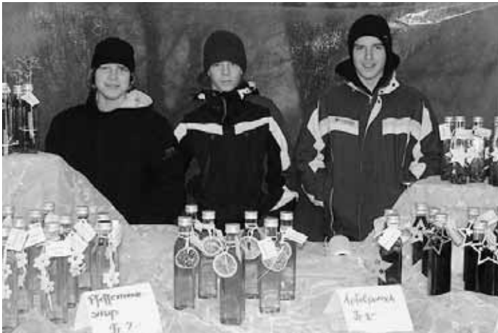
Freiwillige Helfer am liebevoll dekorierten Verkaufsstand.

tierten die Konfirmandinnen und Konfirmanden ihre Ware am Weihnachtsmarkt. Sie erwiesen sich dabei als geschickte Verkäufer und Verkäuferinnen. Auf die Bevölkerung von Gretzenbach war Verlass; die Produkte wurden gelobt und rege gekauft. Die wenigen zurückgebliebenen Flaschen konnten bis Weihnachten auch noch verkauft werden und der Erlös von einigen hundert Franken dem Spendenkonto von «Gretzenbach teilt» überwiesen werden. Ein schönes Weihnachtsgeschenk! Chapeau, liebe Konfirmandinnen und Konfirmanden, für diesen uneigennützigen Einsatz. Es hat sich gelohnt, am Schluss auch für euch – mit einem «Gottesdienstzettel» als Dank für euer mehrstündiges Engagement!