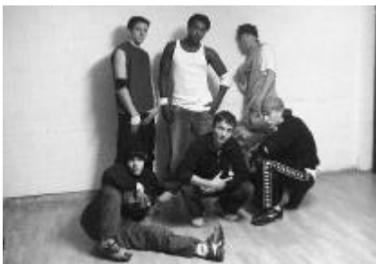
Physical Control aus Gretzenbach.