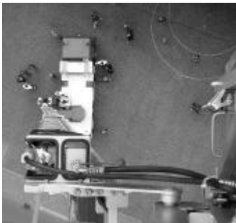
Blick aus 32 m Höhe auf den Platz vor dem Feuerwehrlokal.

Am 21. September 2002 wurde anlässlich einer Übergabefeier die neue Autodrehleiter durch die Firma Rosenbauer an die Regionale Feuerwehr Schönenwerd-Gretzenbach übergeben. Sie ersetzt die bisherige Autodrehleiter aus dem Jahre 1990 mit Jahrgang 1962. Vor zwei Jahren wurde anlässlich der Inspektion durch die Herstellerfirma METZ festgestellt, dass die Leiter den technischen Anforderungen nur noch bedingt genügt. Aus diesem Grund wurde die Lebenserwartung auf zwei bis vier Jahre begrenzt. Aufgrund dieses Prüfungsbescheids wurde durch die Feuerwehrkommission beschlossen, das Fahrzeug nur noch für Rettungseinsätze einzusetzen und auf Dienstleistungen zu verzichten, um die Beanspruchung in Grenzen zu halten. Damit die Beschaffung eines Ersatzfahrzeuges frühzeitig vorbereitet werden konnte, wurde mit anderen Feuerwehren und Lieferanten