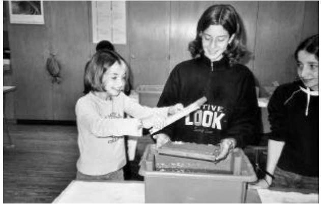
Teamarbeit ist gefragt.