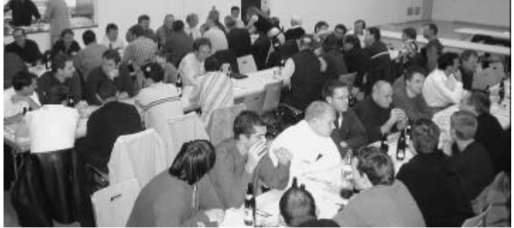
Nachtessen nach dem Fusionsbeschluss in Däniken.

Die Gemeindebehörden begrüßen das Vorgehen und die Anerkennung durch den Schweizerischen Fussballverband ist reine Formsache. Bis zur nächsten gemeinsamen GV sollten die Lücken bei den Funktionären geschlossen und die Detailfragen geklärt sein.