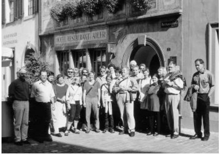
Es blendet die Sonne.

Um es gleich vorwegzunehmen: Es herrschte den ganzen Tag eitel Sonnenschein. Von Chauffeur Marko hervorragend betreut, kamen wir an unser erstes Etappenziel Kempthal, dem beliebten Kaffeehalt mit Gipfeli. Nach der Weiterfahrt Richtung Winterthur erreichten wir das malerische Städtchen Stein am Rhein. Von einer aufgestellten Hostess wurden wir durch das Städtchen geführt, vorbei an schmucken Riegelhäusern, teilweise mit historischen Gemälden, Erkern und wunderschönen Blumen geschmückt. In einem Hinterhof fühlten wir uns in die frühere Zeit zurückversetzt, ein paar Schritte weiter hatte uns die Gegenwart schon wieder eingeholt. Diese Führung war sehr interessant und lehrreich und wurde mit einem Lied verdankt. Nach dem vorzüglichen Mittagessen im Restaurant Adler übten wir in einem Klostersgarten ein paar Lieder für unseren Auftritt am Abend, denn unser Mitglied Jo-