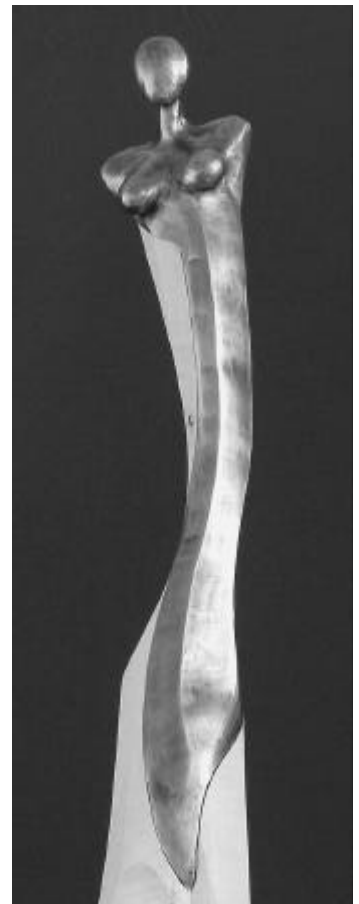
Das Gold der Armen.