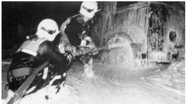
Einsatz von Schaumteppich Lagerhausbrand Schönenwerd.