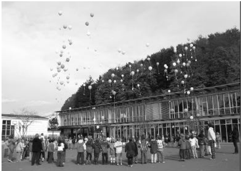
Mein Ballon fliegt sicher am weitesten!