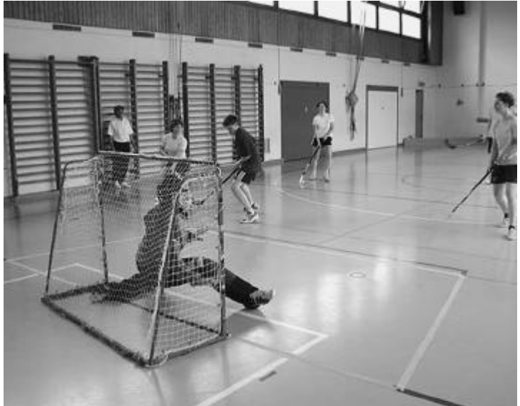
Gooooaalll! (Unihockeyturnier in Bremgarten).

Die sportlichen Cevianer im Leiteralter treffen sich einmal pro Woche in der Turnhalle Gretzenbach zum «Unihöckle», zum