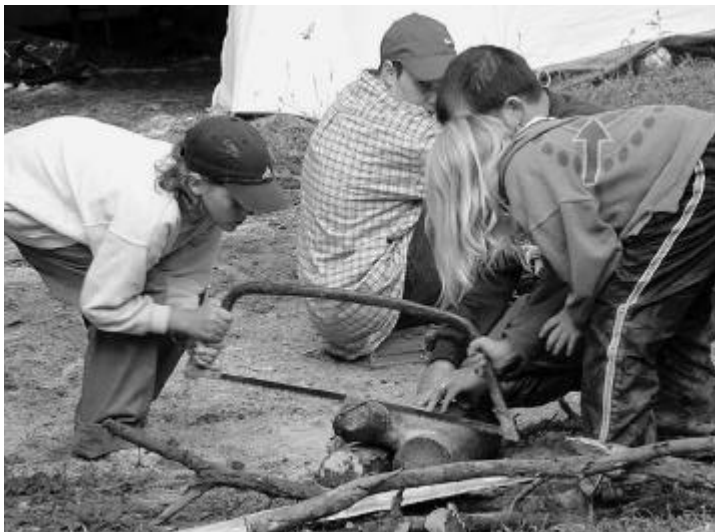
Keiner zu jung, um mitzuhelfen (Sommerlager 2002).

wacht Blauring zu den drei grössten Kinder- und Jugendorganisationen gehört, bietet ein breites Spektrum an Freizeitbeschäftigungen. Ob Freude an der Musik, Interesse an Action in der Natur oder das Bedürfnis, mit gleichgesinnten Menschen in Jugendgruppen interessante Gespräche zu führen, der Cevi bietet für jeden das Richtige. Auch der Cevi Gretzenbach bietet eine breite Palette an Freizeitangeboten für Kinder und Jugendliche. Wichtigstes Standbein der Cevi Gretzenbach ist wohl die Jungschar. Kinder im Schulalter, in altersabgestuften Gruppen, erleben miteinander spannende Geschichten in der Natur, bauen Gruppenplätze, lernen Knoten und erkunden Kompass, Karte und die Natur. Und dies schon seit fast zehn Jahren. Die Jugendlichen im Oberstufenalter erforschen Höhlen, klettern Felswände hoch und konstruieren