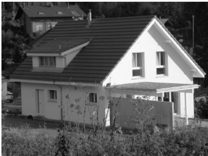
Erstes Haus im «Ölihof».