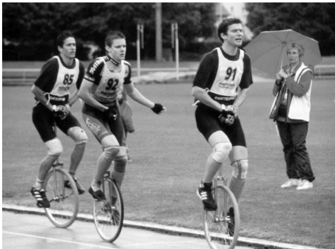
Drei ehemalige und aktuelle Weltmeister im Endspurt.

Wie viele wissen, gehört die Schweiz neben Deutschland, USA, China und Japan zu den führenden Einradnationen der Welt.