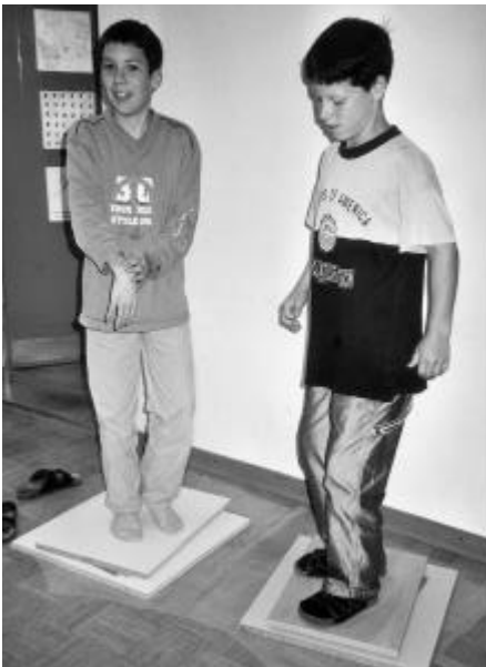
Mit dem eigenen Körpergewicht werden die Papiere zwischen zwei Brettern gepresst.