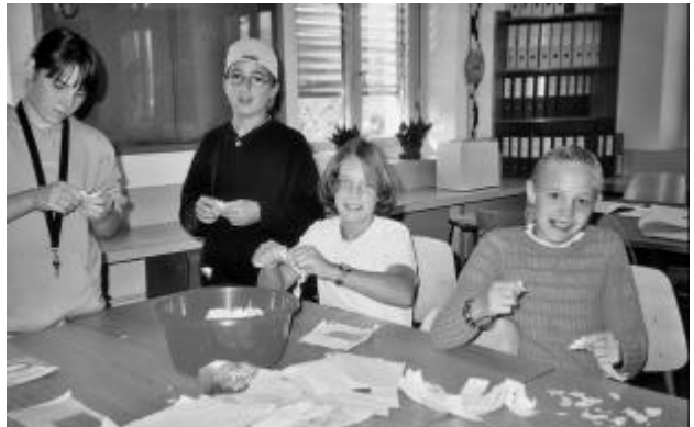
Rohmaterial aus dem Papierkorb.