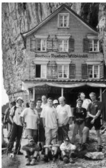
Frisch gestärkt nach einer Rast im Wildkirchli.

Bei prächtigem Hochsommerwetter startete eine gutgelaunte Gruppe am 17. August 2002 die