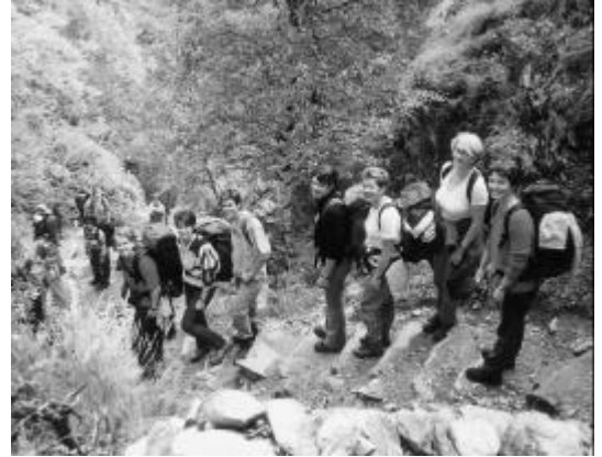
Auf dem Weg nach Mund.

Am 21. September war es wieder einmal soweit: Die Damenriege Gretzenbach ging auf Reisen. Aber wohin sollte es dieses Mal gehen? In Olten wurde klar, dass wir Richtung Kandersteg fahren. Nach dem Tunnel, in Hohtenn, war Endstation. Von hier aus starteten wir zu Fuss Richtung Süden auf der herrlichen «Lötschberg – Südrampe-Wanderung». Nach kurzem Einlaufen gab es auch schon Halt beim Bergbeizli Rarnerkummen, wo wir uns mit einem Morgenkaffee auf die bevorstehende Wanderung stärken konnten. Nun ging es den Bergen entlang mit wunderschöner Aussicht ins Tal. An einem schönen Rastplatz mit Sicht auf Visp machten wir unsere Mittagsrast. Hier genehmigten wir uns auch unseren «Gipfelwein». Am Nachmittag wurde die Wanderung immer schöner. Wir tauchten in lauschige