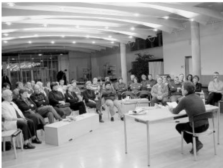
Die Faszination des Zuhörens.

Er zitierte aus dem Buch «Die Schöne der Welt oder der Weg zurück». Darin beschrieb er eine Männerfreundschaft von zwei Italienern, die beide ihre Jugend in der Schweiz verbracht haben. Einer von ihnen geht nach 15