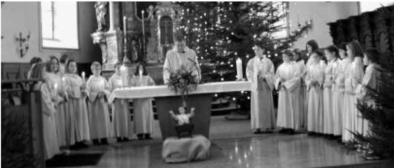
Die frisch eingekleideten Ministranten bei ihrer ersten Assistenzaufgabe.