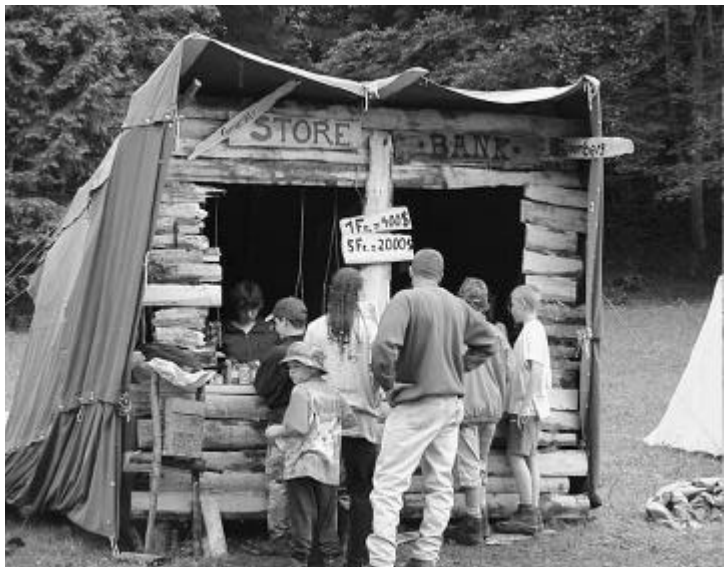
Zeltlager im Wilden Westen.

«Tschüttele» oder zum Ausüben von anderen Teamsportarten auf Plauschniveau. Alljährlich neh-