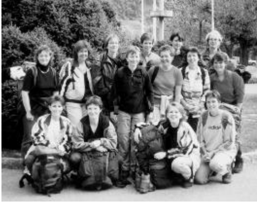
Frisch und guten Mutes.

Am 21. September war es wieder einmal soweit: Die Damenriege Gretzenbach ging auf Reisen. Aber wohin sollte es dieses Mal gehen? In Olten wurde klar, dass wir Richtung Kandersteg fahren. Nach dem Tunnel, in Hohtenn, war Endstation. Von hier aus starteten wir zu Fuss Richtung Süden auf der herrlichen «Lötschberg – Südrampe-Wanderung». Nach kurzem Einlaufen gab es auch schon Halt beim Bergbeizli Rarnerkummen, wo wir uns mit einem Morgenkaffee auf die bevorstehende Wanderung stärken konnten. Nun ging es den Bergen entlang mit wunderschöner Aussicht ins Tal. An einem schönen Rastplatz mit Sicht auf Visp machten wir unsere Mittagsrast. Hier genehmigten wir uns auch unseren «Gipfelwein». Am Nachmittag wurde die Wanderung immer schöner. Wir tauchten in lauschige