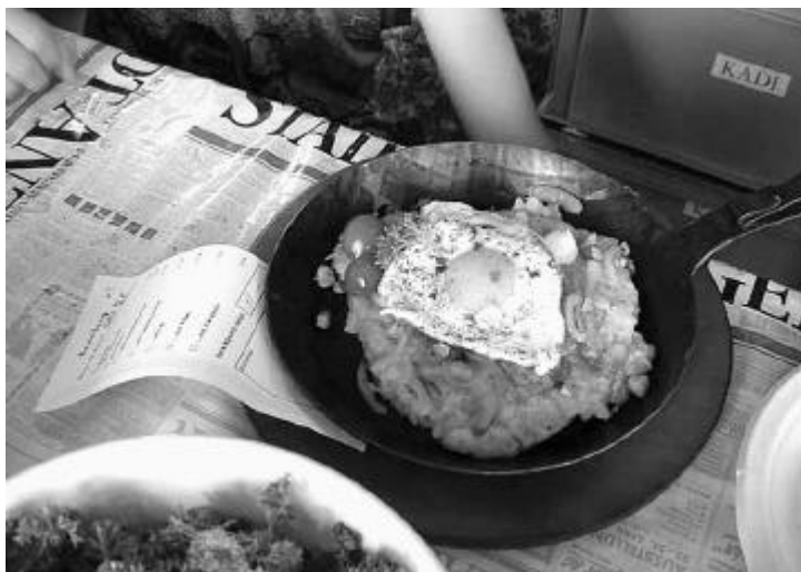
Mampf – Die berühmte Cevi-Röstli am Beizlifäscht.