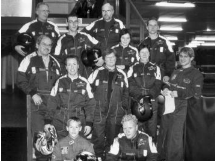
Die Gretzenbacher Kartmeister.