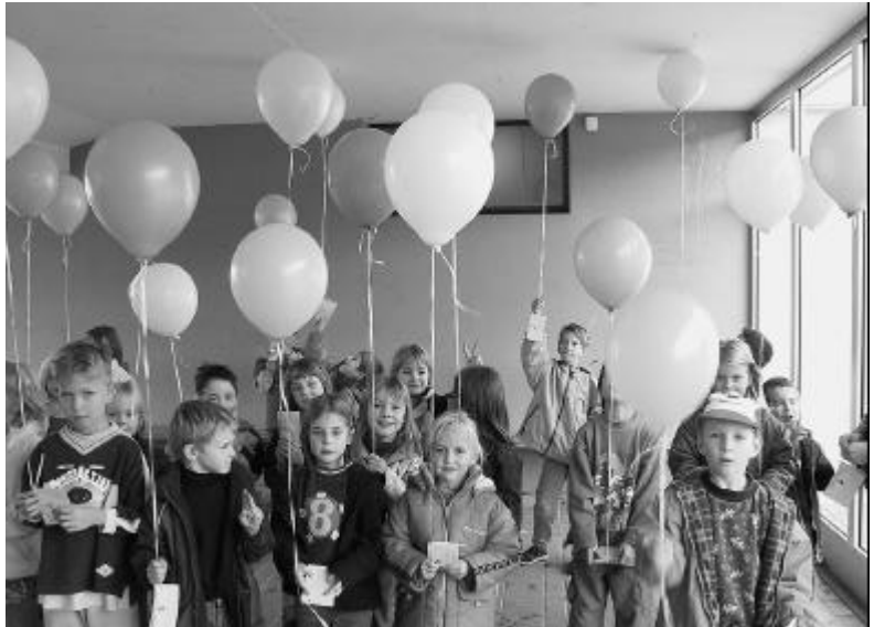
Wann geht es endlich los?