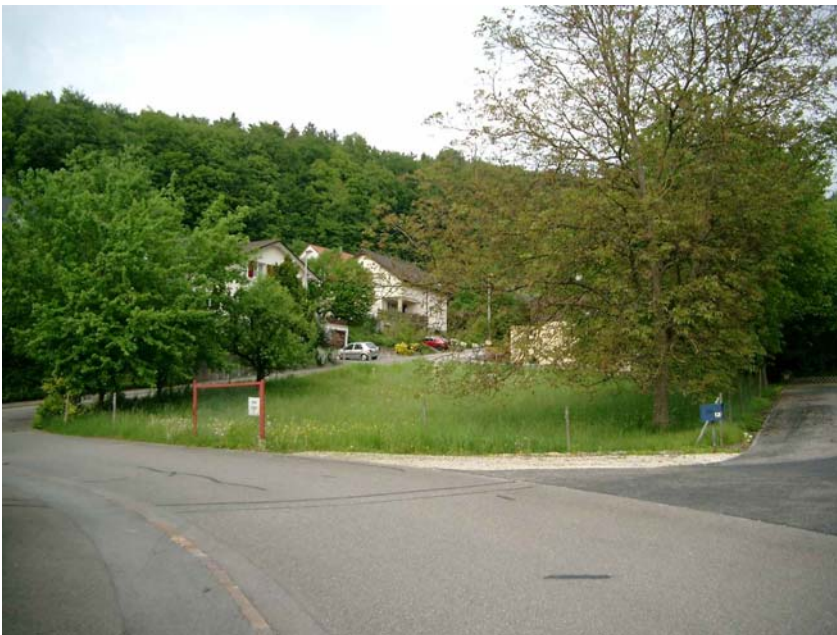
ANSICHT VON SÜD-WEST