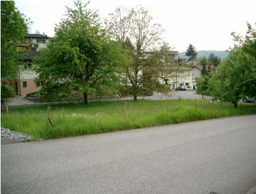
ANSICHT VON NORD-OST

V - Preis Fr. 325.-- / m 2 (keine Verpflichtungen) // Kontakt : P 062 849 44 23 G 062 836 05 30