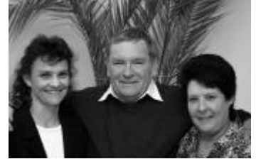
Die neuen Ehrenmitglieder

Nach Beendigung der Generalversammlung schritt man gleich zur ersten OK-Sitzung für den 17. Behindertensporttag vom kommenden Bettag-Samstag. Dieser Sporttag wird sich im üblichen, bewährten Rahmen präsentieren. Es hat sich letztes Jahr gezeigt, dass die Crew des Behindertensporttages flexibel genug ist, um diesen speziellen Tag auch bei regnerischem und kaltem Wetter durchzuführen. Die verantwortlichen Organisatoren und die zahlreichen, begeisterungsfähigen Behindertensportler freuen sich