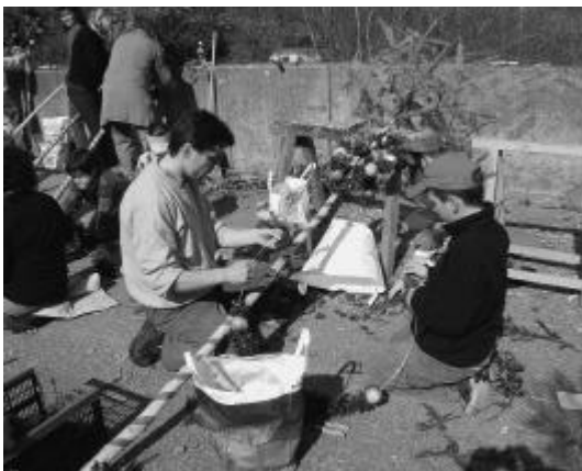
Konzentriertes Schmücken der Palme