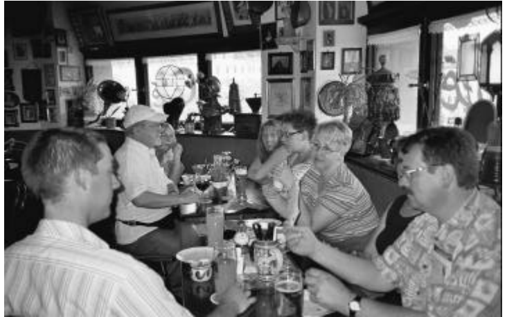
Impression aus dem Turmstüberl in München.