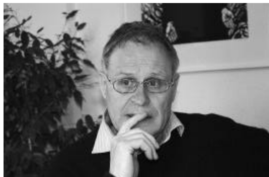
Neue Impulse sind wichtig – in der Pfarrei wie auch in der katholischen Kirche.

Die Bereitschaft und wohl auch die Kraft, Bestehendes anzupassen, fehlt heute zeitweise. So wurde früher intensiver mit jun-