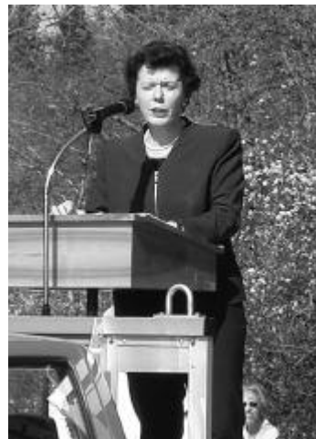
Hoher Besuch: Regierungsrätin Esther Gassler.

Regierungsrätin Esther Gassler betonte das Trennende und Verbindende des Wassers und wie Brücken die Verbindung garantieren könnten. «Durch diese wunderschöne Brücke wird der Bally-Park noch mehr ins Zentrum gerückt», freute sich die ehemalige Schönenwerder Gemeindepräsidentin.