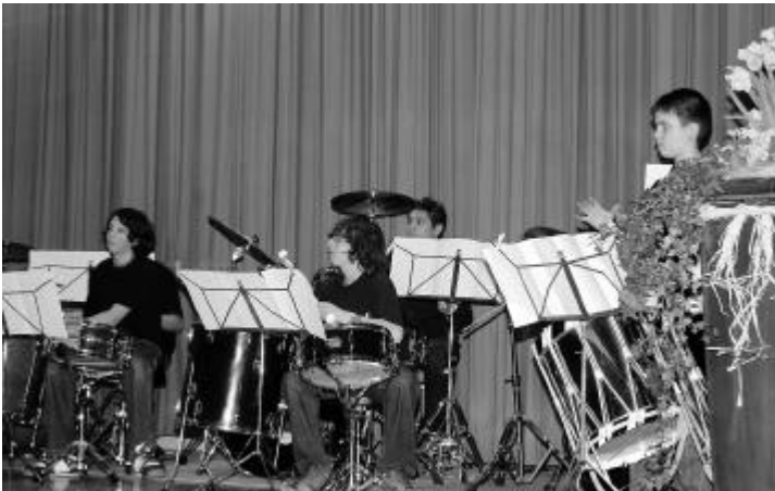
Die Schlagzeugschüler spielten, was die Trommeln und Becken hielten.

Es ist eine schöne Tradition in Gretzenbach, dass am Vorabend des Ehrentages der Musikverein