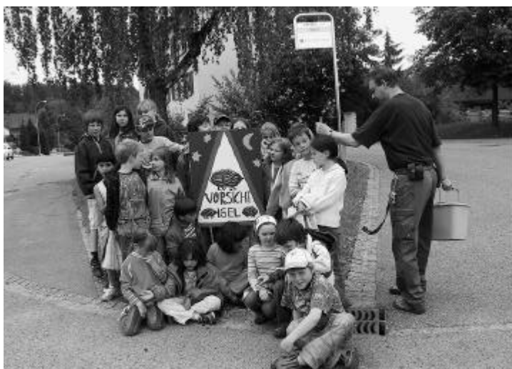
Das ganze Igelteam.

Im Werken wurden Igelplakate entworfen und gemalt. Stolz auf ihren Beitrag, trugen die Kinder