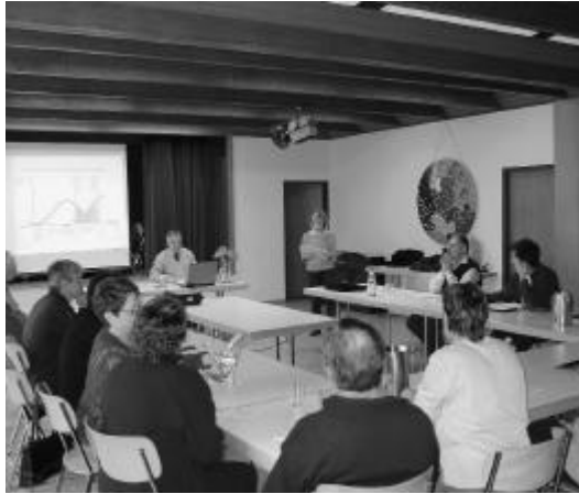
Engagierte Diskussionen zur Rolle der Kirche.