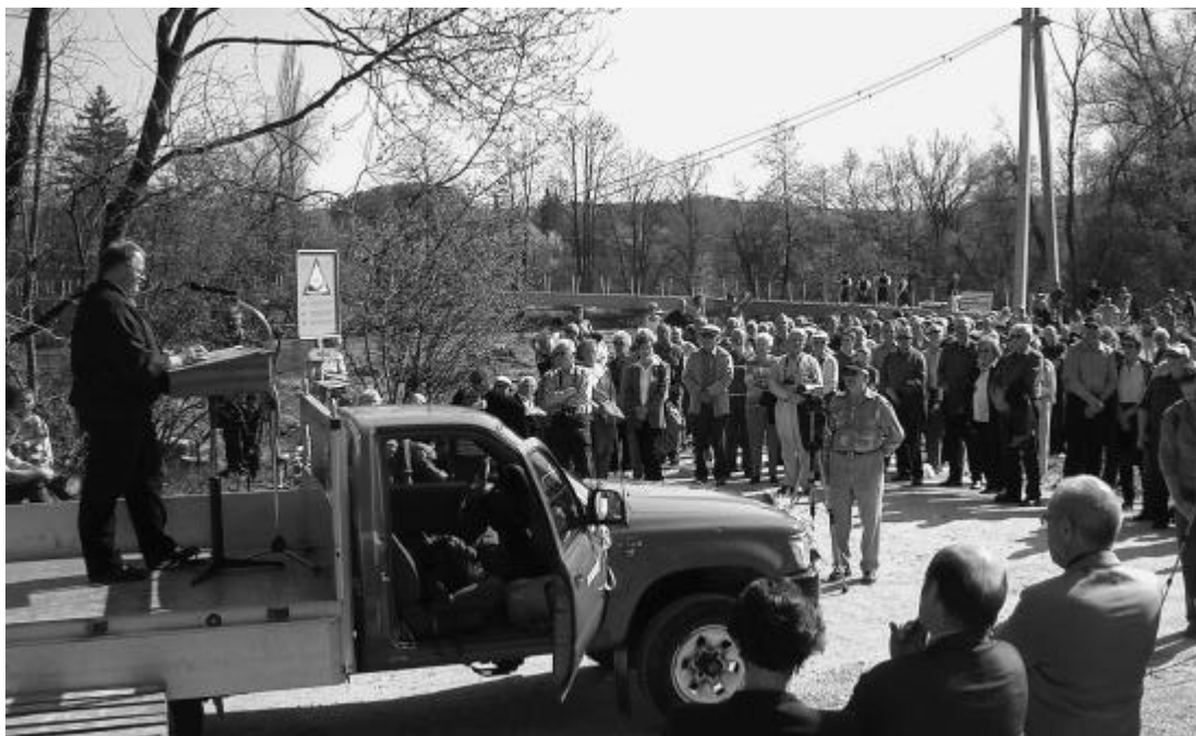
Gut besuchte Einweihungsfeier.