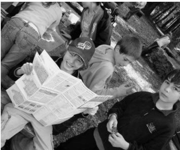
Wo bitte geht's hier durch?