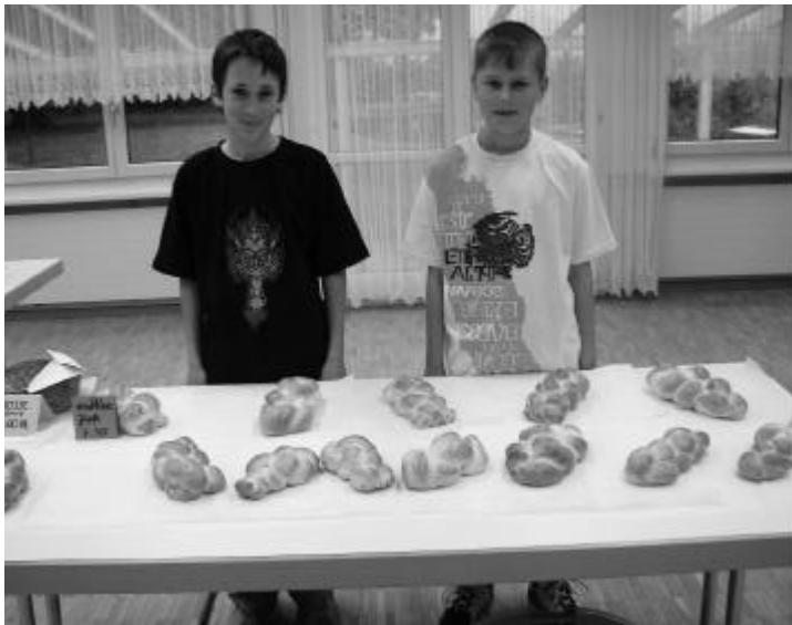
Der Bazarerlös von Fr. 1050.– kommt den Kindern in Recife zugute.