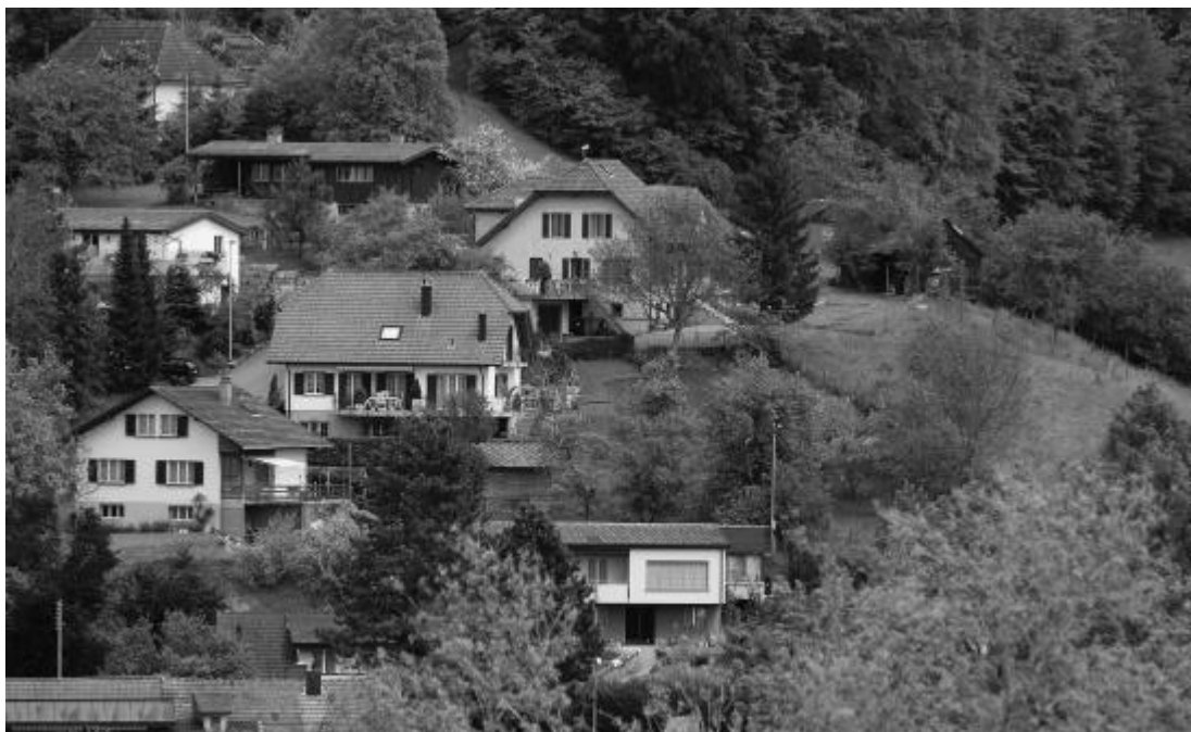
Baugebiet Landhubel (Bildmitte und rechts).

Die Gebiete Kohlschwärzi und Möösli liegen in Gretzenbach nicht in der Bauzone. Diese Liegenschaften sind grundsätzlich selber für ihre Wasserversorgung verantwortlich. Trotzdem hatte der Gemeinderat an einer früheren Sitzung beschlossen, den Liegenschaftsbesitzern ein Erschliessungskonzept für Löschwasser und Wasserversorgung mit finanzieller Beteiligung der Gemeinde vorzuschlagen.