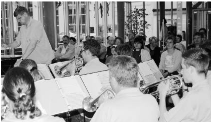
Die Mütter wurden auf ihren Ehrentag eingestimmt.

die Mütter zu einem Konzert einlädt. Unter der kundigen Leitung ihres Dirigenten Rolf Minder wurde den zahlreich Anwesenden ein abwechslungsreiches Konzert geboten. Das zirka einstündige Konzert beinhaltete Märsche, Polkas sowie moderne Weisen. Infolge des schlechten Wetters fand der Anlass in der Bibliothek Meridian statt. Die Vorträge wurden mit grossem Applaus verdankt. Anschliessend offerierte der Musikverein den Gästen einen Apéro.