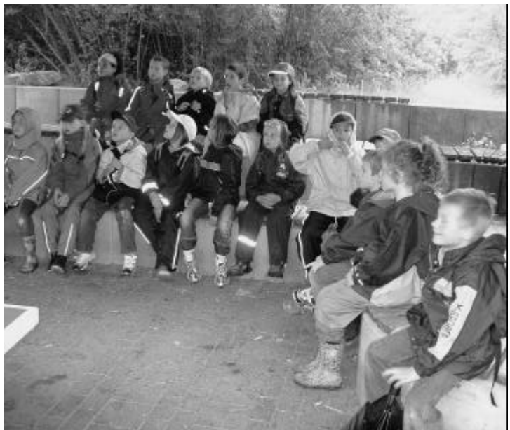
Was erleben wir im Wald?