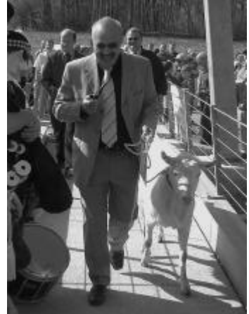
Die erste Seele, die über die Brücke geht.