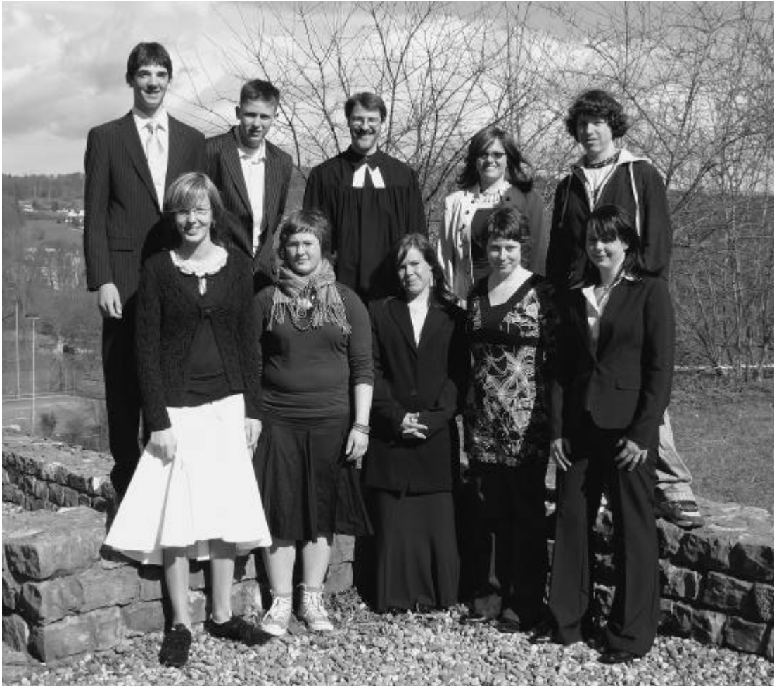
Eine feierliche Schar.

ges Leben». Leben, das göltig ist und Bestand hat. Leben, das gut, glücklich, heil und so rundherum erfüllt ist, dass nicht einmal der Tod eine wirkliche Bedrohung dafür ist. Leben, das in den Augen der Menschen und in den Augen Gottes sehr gut ist. Die Geschichte in der Bibel hat kein Happy-End. Der junge Mann geht traurig davon, weil