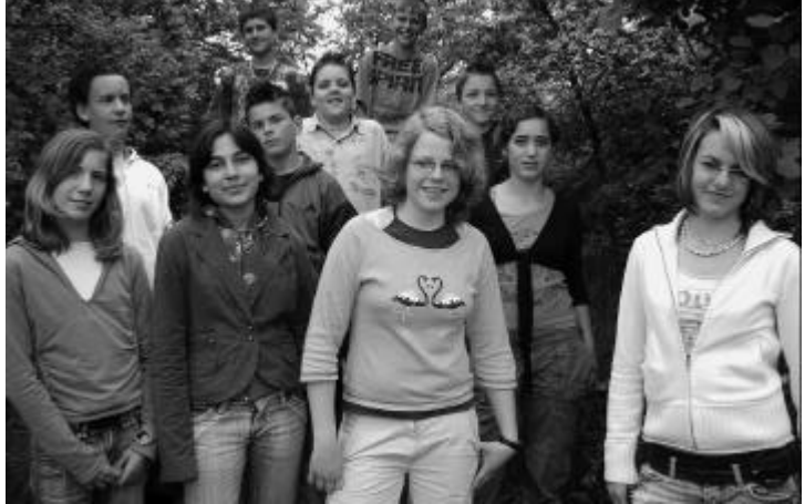
Die aufgestellten Firmlinge des Jahres 2006.

So ein Beziehungsnetz haben wir im Muttertagsgottesdienst sichtbar gemacht, indem wir eine Schnur von Firmling zu Firmling spannten, bis jeder mit jedem