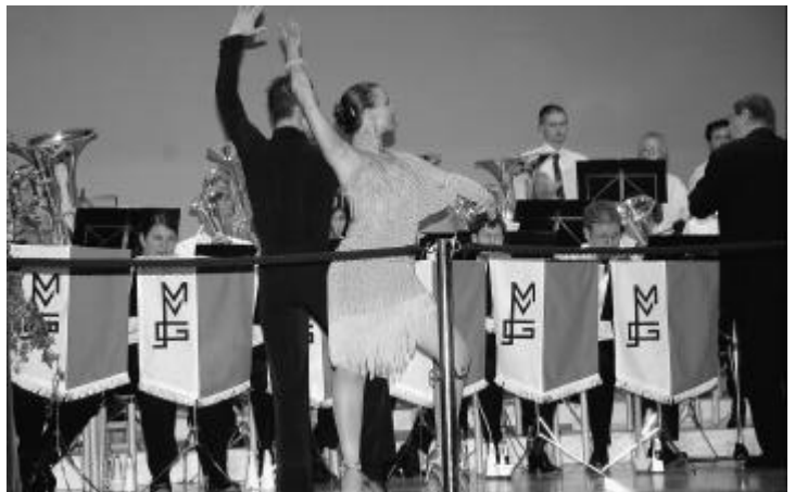
«Dancing Brass» mit Tanzpaar umgesetzt.

Vor vollen Rängen durfte Ende März in der Turnhalle das Jahreskonzert aufgeführt werden. Das ausgewählte Motto «Dancing Brass» wurde nicht nur bei der Auswahl der Vorträge berücksichtigt, ein Tanzpaar führte zu den Klängen Rock'n Roll und Tangotänze auf. Im ersten Teil des Abends wurde das Selbstwahlstück des Eidg. Musik-