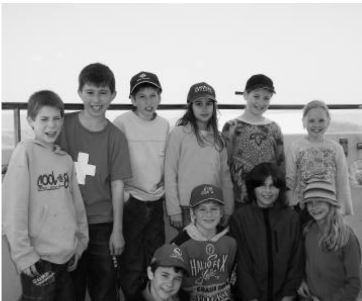
Gruppenfoto auf dem Esterliturm.