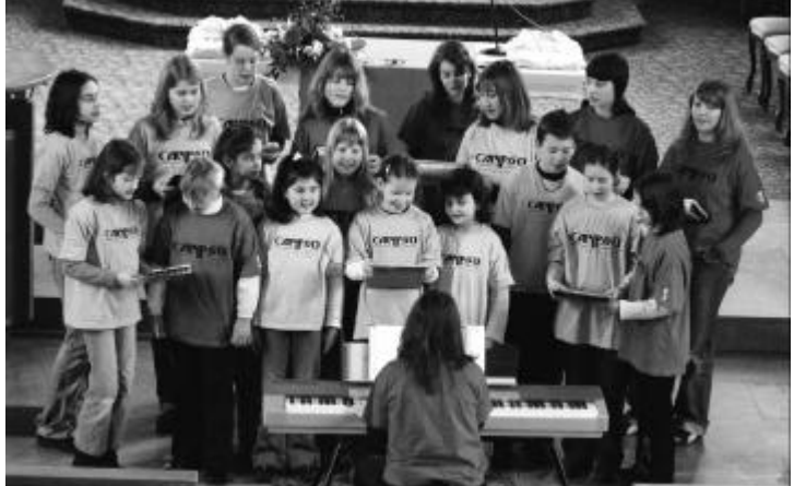
Singen aus Freude: Der Calypso Jugendchor.

Der Jugendchor Calypso ist in der Zwischenzeit nicht mehr aus der Region wegzudenken. An unzähligen Festen in Kirche und Bevölkerung konnten wir die positive Kraft des Chores spüren und erleben. Er bietet den Kindern und Jugendlichen eine sinnvolle und geschätzte Freizeitplattform. Seit Januar 2006 besteht bekanntlich der Trägerverein Calypso-Jugendchor, welcher nun als rechtlicher Rahmen zur Verfügung steht. Erfreulicherweise haben sich alle bisherigen Singenden entschlossen, weiter zu machen. Ziel ist nun, weitere fünf bis zehn Jugendliche zur Teilnahme zu begeistern. Aber es werden auch weitere Aktivmitglieder und Gönner gesucht, um den personellen und finanziellen Rahmen für einen weiteren Aufbau des Chors zu ermöglichen. Machst Du mit? Machen Sie mit?