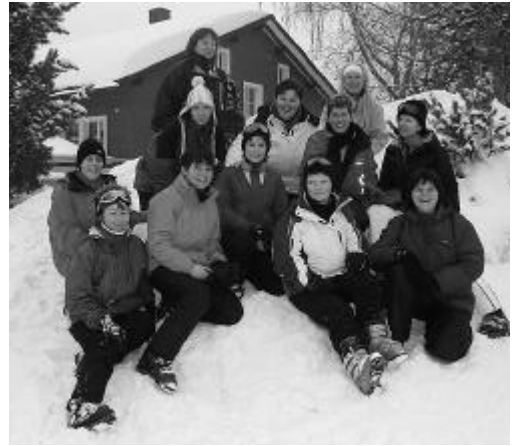
Die coolen Frauen.

ter von einer bes- seren Seite. Bei Sonnenschein vergnügten sich einige auf den kräfteaubenden Buckelpisten, während andere die flacheren Ab- fahrten bevorzug- ten. Nach der letzten Talfahrt machten wir uns zufrieden, etwas müde aber gutgelaunt und um einige Erleb- nisse reicher auf den Heimweg.