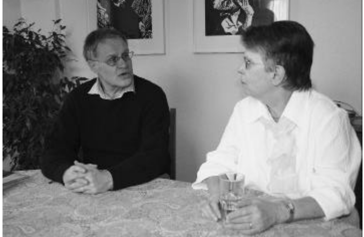
Unsere Kirche ist eine im Dorf verwurzelte Institution