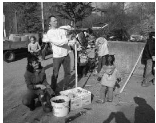
Ein prüfender Blick.