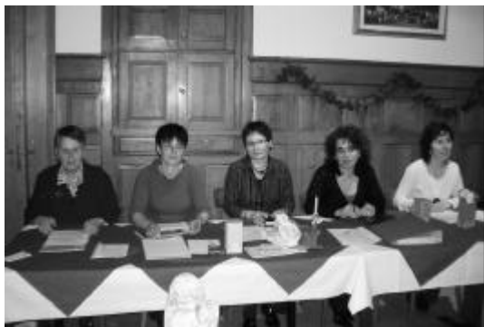
Ein Teil unseres zehnköpfigen Teams