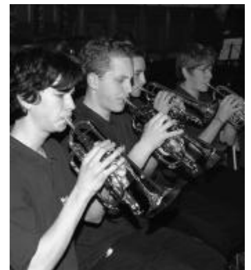
Die Brass Kids Niederamt eröffneten das Gretzenbacher Adventskonzert