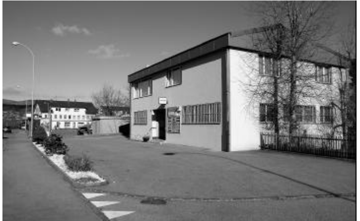
Zu verkaufen: Die Liegenschaft mit der Post Gretzenbach

Werner Strub hat sein Gebäude mit Post und Sechszimmerwohnung der Einwohnergemeinde angeboten, bevor er damit auf den freien Markt geht. Der Gemeinderat diskutierte die verschiedenen aufgeführten Szenarien. Im Interesse vor allem auch der älteren Mitbürger will er sich für die Erhaltung der eigenen Post einsetzen. Es ist aber klar, dass die Post kaum langfristige verbindliche Zusagen machen wird. Brief- und Paketverkehr wie auch Zahlungen sind enorm zurückgegangen. Selbst ein Kauf des Gebäudes durch die Einwohnergemeinde gäbe keine Garantie, dass die Poststelle bleibt. Unter diesen Voraussetzungen lehnte der einstimmige Gemeinderat den Kauf des Postgebäudes ab.