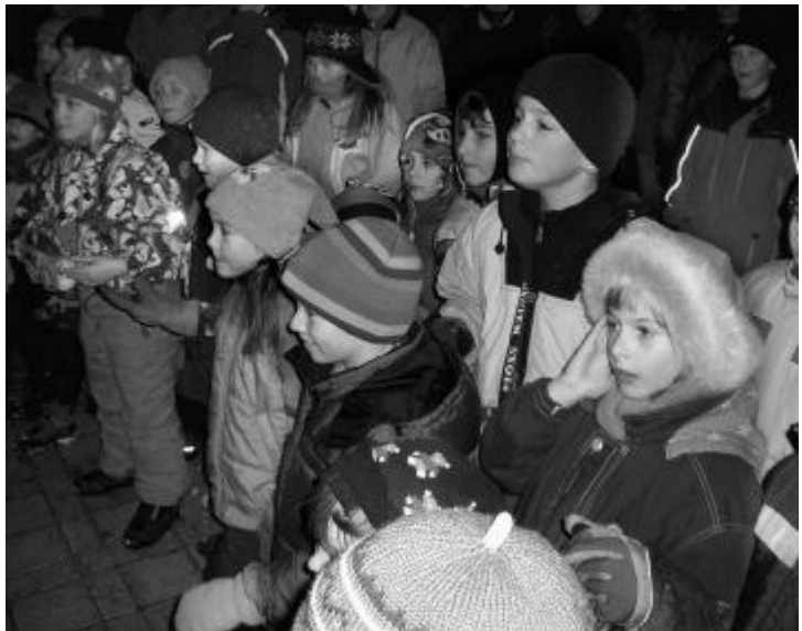
Stauende Kinder am Posten «Sinn der Weihnachten»

Vielen Dank den Organisatoren dieser speziellen Waldweihnacht.