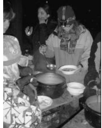
Suppe mit Wurst

Beim Waldhaus angekommen, brannten die Lagerfeuer und wir konnten uns wieder aufwärmen. Damit der Magen auch wieder warm wurde, gab es die traditionelle Suppe mit Wurst für alle. Die 2 Gruppen hatten in der letzten Zeit Prüfungen absolviert und wurden in höhere Ränge befördert. Unter dem eigens für die Waldweihnacht errichteten Zelt wurden den «Kids» ihre Rangabzeichen überreicht. Stolz trug die Gruppe Titus ihr neues Halstuch. Sie sind jetzt «Jungschärler». Trotz Schneefall und kalten Temperaturen kam beim anschliessenden Singen warme, weihnachtliche Stimmung auf.