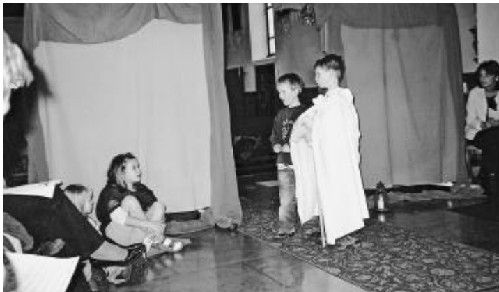
Die Kinder sind mit Eifer dabei

den anderen Besuchern teilen mussten, um ihnen das Teilen nochmals vor Augen zu führen. Im Dezember fand die letzte Chinderfiir des Jahres unter dem Motto «Das Weihnachtsfest» statt. Ein kurzer Jahresrückblick und dann die Frage «Was gehört alles zu einem Weihnachtsfest?» Da wusste jedes Kind etwas zu berichten: natürlich Geschenke, ein Weihnachtsbaum, die Krippe, feine Guetzli und noch vieles mehr. Das letzte «Bhaltis», das die Kinder in diesem Jahr bekamen, war ein aus Teigwaren gefertigter wunderschöner, silbriger Engel. Und wie jedes Jahr liessen alle das Chinderfiirjahr bei Suppe und Wurst im Römersaal ausklingen.