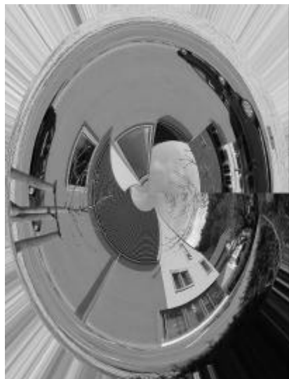
Das Gemeindehaus einmal anders.