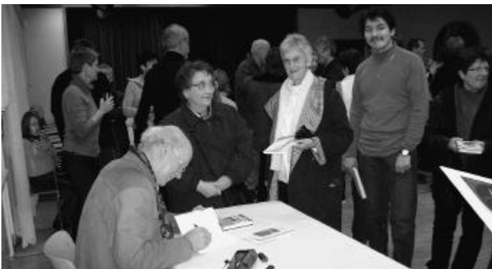
Andrang für die Signierung

Text: Werner Strub