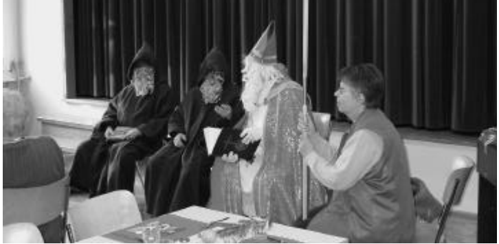
Kann ich alles erzählen, was in diesem Buch steht?

Text: Ursula Schenker-Studer