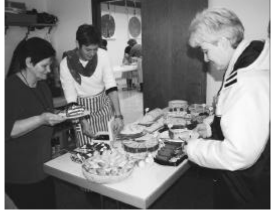
Das Kuchenbuffet lockt

Zum achten und letzten Mal fand am 15. Januar das traditionelle Spaghettiesen des Kirchenchors statt.