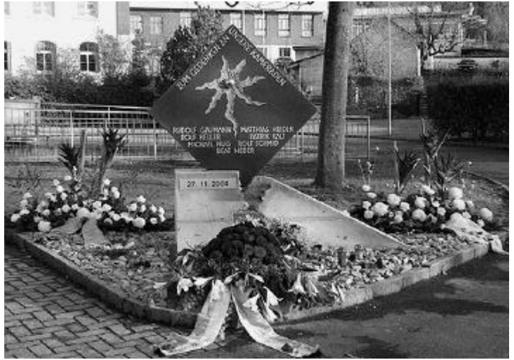
Jahrestag des Staldenackerunglücks

Das Objekt der Familie Münger erhielt die meisten Stimmen. Das Kunstwerk besteht aus einem Betonsockel sowie einer Granitplatte mit einer Metallkugel im Zentrum der Platte.