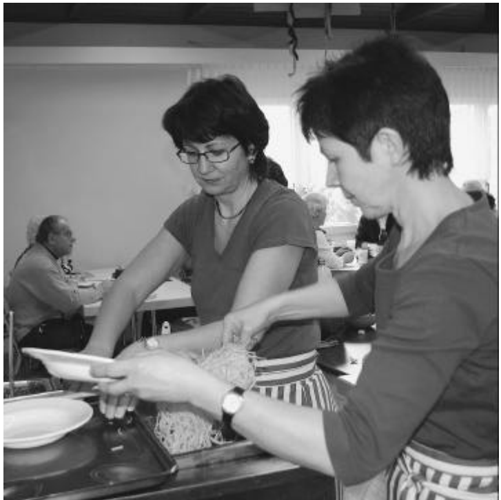
Volle Konzentration beim Schöpfen