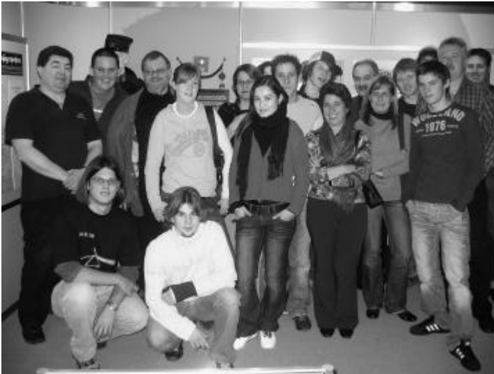
Die interessierten Jungbürger von Gretzenbach

Am 18. November 2005 um 17.00 Uhr besammelten sich elf Jungbürger und zehn Gemeinderäte beim Polizeikommando Aargau in Aarau für eine Führung durch ein für die meisten Teilnehmer unbekanntes Territorium.