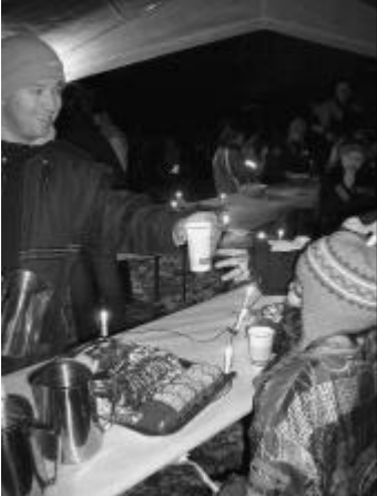
Begrüssung mit warmem Tee

Die traditionelle Waldweihnacht der Cevianer stand unter dem Motto «Geschenke». Bei bitterkalter Witterung versammelten sich die Teilnehmer der Waldweihnacht beim Römersaal. Bereits hier zeigte sich die gute Organisation. Kuchen und andere Snacks wurden mit heissen Getränken in einem Zelt serviert. Punkt 17.00 stimmte uns ein «Engel» auf die bevorstehende Feier ein. Gestärkt durch den Kuchen, führten uns die Leiter und Hilfsleiter an verschiedene Posten bis zum Waldhaus. Anschaulich wurde uns der Sinn der Weihnacht in unserer Gesellschaft vorgeführt. Sind es Geschenke, möglichst das Neueste und das Grösste? Was Weihnachten tatsächlich sein sollte, wurde uns an einem Posten vor Augen geführt.