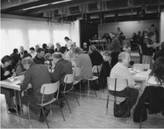
Zahlreichen Besuchern schmeckt es