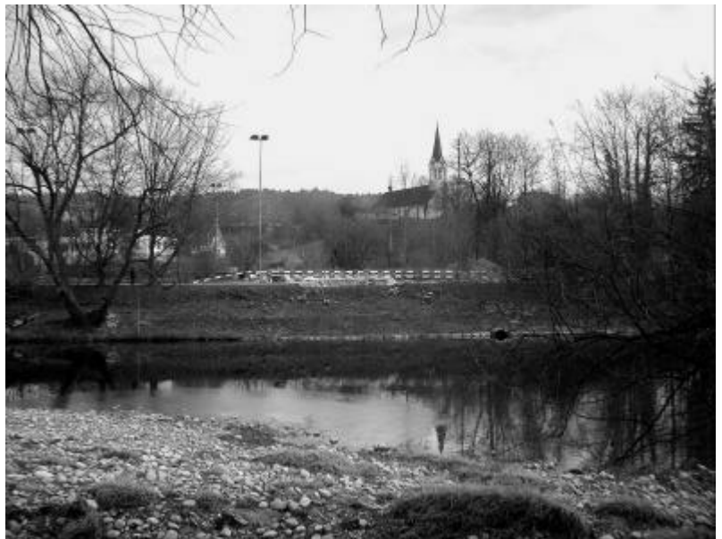
Standort der neuen Brücke