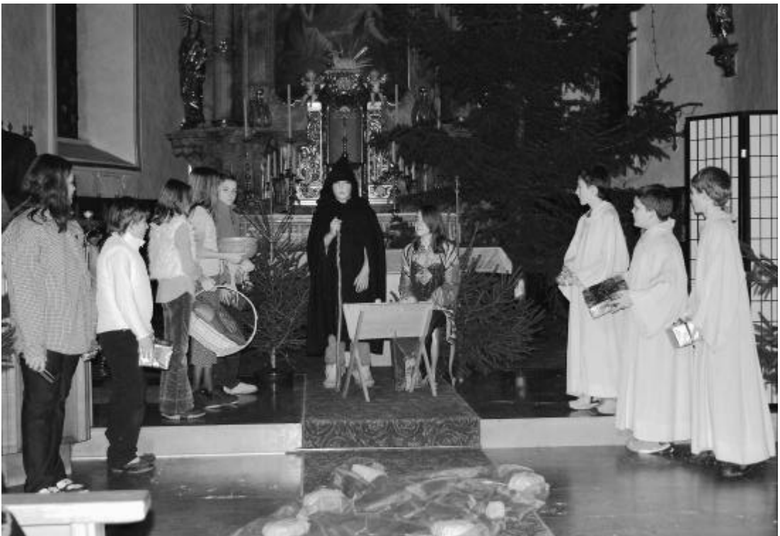
Szene aus dem Krippenspiel