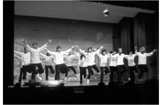
Die flinken Köche der Damenriege

Noch vor dem Turnerabend nahm der TV Gretzenbach am regionalen Unihockeyturnier in Olten teil. Dabei wurde der Finalinzug nur aufgrund der weniger