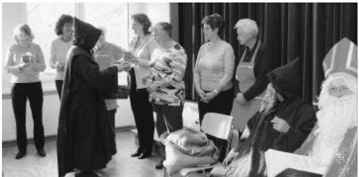
Die Helferinnen werden mit einem Geschenk belohnt