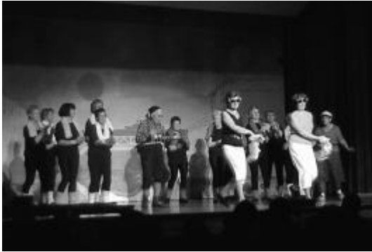
Frauenriege beim Wandern

Noch vor dem Turnerabend nahm der TV Gretzenbach am regionalen Unihockeyturnier in Olten teil. Dabei wurde der Finalinzug nur aufgrund der weniger