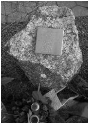
Gedenkstein in Gretzenbach

Schon bald waren sich die Gremien der Feuerwehr einig, dass das Unglück vom 27. November nicht nur in den Herzen sondern auch sichtbar in Erinnerung bleiben muss. Aus diesem Grund startete man einen Wettbewerb für eine Gedenkstätte mit den Namen der verunglückten Feuerwehrmänner. Drei Künstler konnten ihre Ideen der Feuerwehr und den Hinterbliebenen an einer speziellen Veranstaltung vorstellen. Hier äusseren sie die Gedanken, die hinter ihren Projekten standen. Die Anwesenden konnten innerhalb einer Frist ihre Stimme für ein Projekt abgeben.