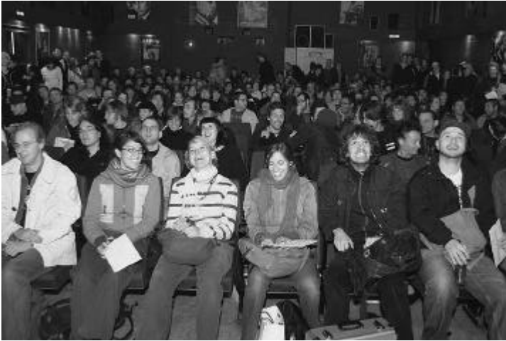
Start zum Movie-Marathon 2006 im Uto-Kino in Zürich