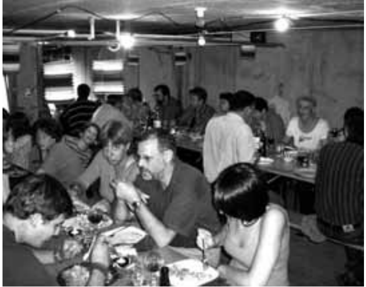
Party in der Garage