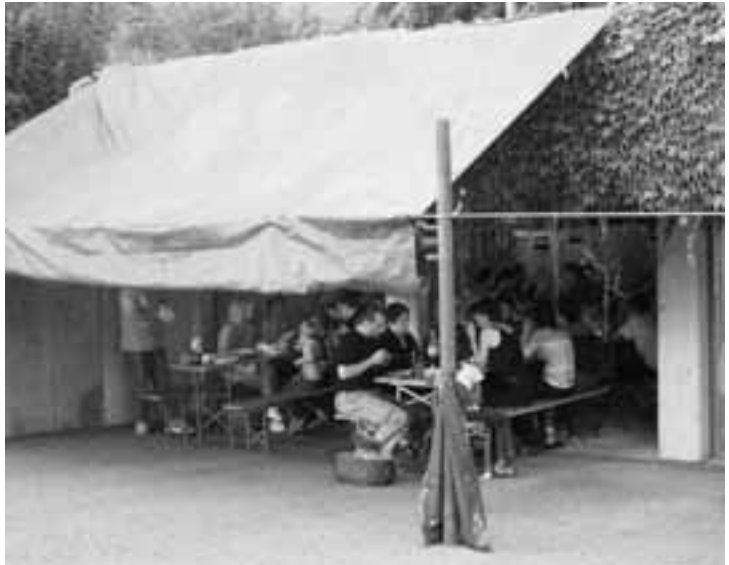
Gut geschützt kann man lange Sitzen bleiben