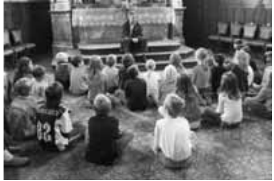
Aufmerksam lauschen die Kinder der Geschichte