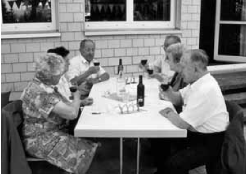
Senioren geniessen das schöne Wetter unter der neuen «Pergola»