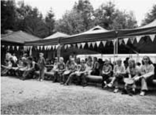
Das kurze Warten auf das Essen