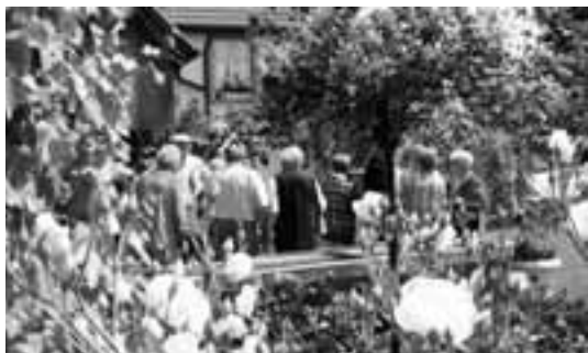
Der Besuch im Rosengarten

Text: Ursula Schenker