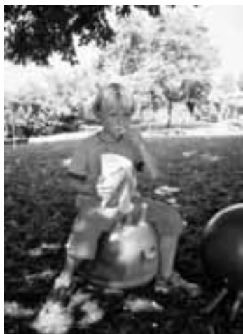
Popkorn ist etwas Feines

Rund 200 Kinder hatten wirklich den Plausch an unseren Angeboten unter den Linden hinter der Kirche. Zum 7. Mal stellte die Spielgruppe den attraktiven Spielplausch zusammen für die kleineren Beizlifestbesucher von ca. 3- bis 11-jährig. Bei schönstem Spätsommerwetter konnten sich die Kinder beim Spielen, Basteln, Hüpfen, Fischen und Büchsen werfen vergnügen. Wer Durst und Hunger hatte, wurde im Kinderbeizli mit Eistee, Schoggibrötli oder Küchlein gepflegt, dazu durfte noch eine Tüte Pop-Corn