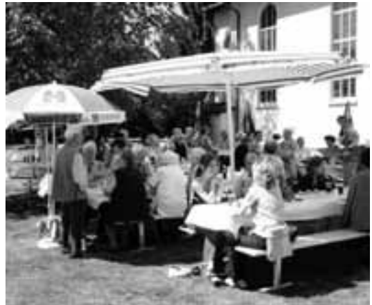
Petrus hat unsere Bitten erhört und uns reichlich mit Sonne verwöhnt