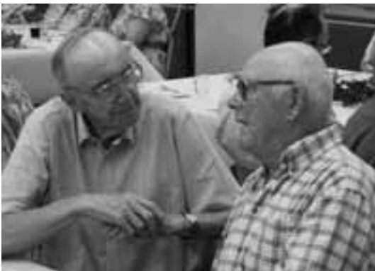
Zwei ältere Herren unter sich