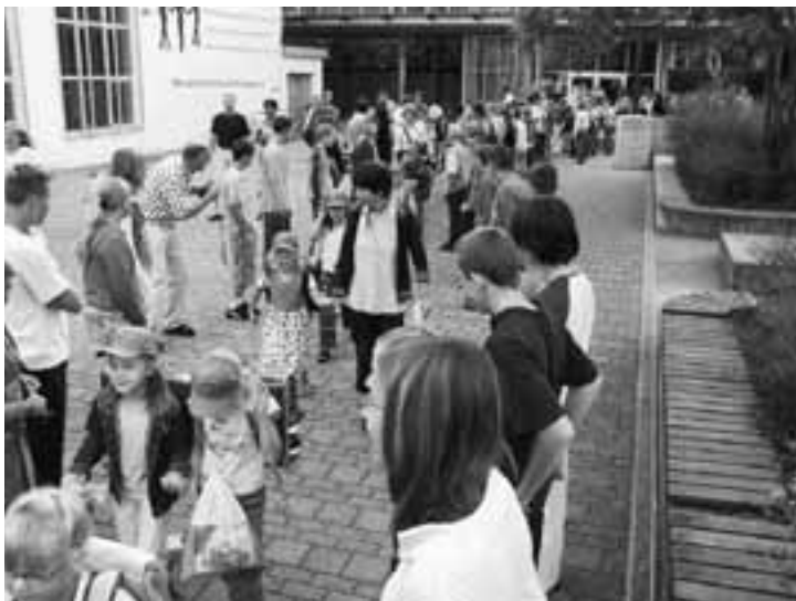
Hand in Hand geht vieles leichter