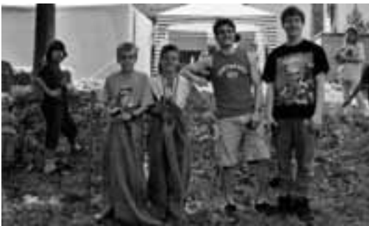
Helfer und motivierte Teilnehmer