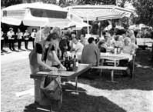
Keine Angst! Niemand muss Durst haben!