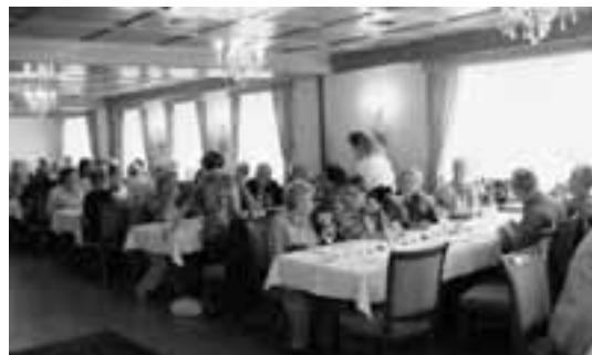
Im schön geschmückten Säli