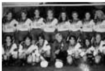
Damenmannschaft FC Däniken-Gretzenbach

10 Jahre nach der erstmaligen Gründung einer weiblichen Fussballmannschaft herrscht wieder Aufbruchstimmung beim FC Däniken-Gretzenbach. Die Gründung der heutigen Damenmannschaft wurde von damaligen Juniorinnen, welche von 1994–1998 beim FC Gretzenbach die Fussballschuhe schnürten, initiiert. Damals im Jahre 1998 fiel das Juniorinnen-Team aus verschiedensten Gründen