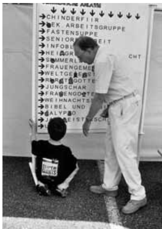
...wurden die Jüngeren beim Rätsellösen betreut