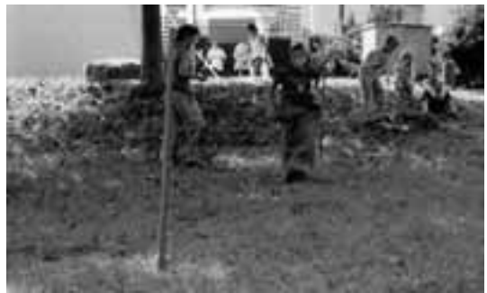
Mit vollem Einsatz