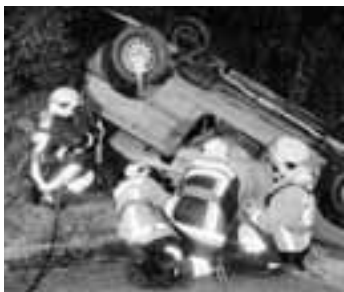
Zusammenarbeit Sicherungstrupp und Befreiungstrupp