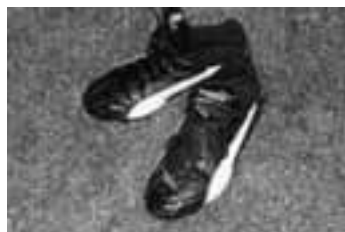
Auch Frauen können Fussballschuhe tragen

auseinander. Die damaligen Protagonistinnen behielten jedoch den Kontakt untereinander und aufgrund der Eigeninitiative einzelner Spielerinnen sowie dank dem Interesse und der Unterstützung des Vereins, konnte innert kurzer Zeit ein Damenfussballteam auf die Beine gestellt werden. Nun stehen sie also wieder auf dem Rasen: 15 Damen und Mädchen zwischen 15 und 30 Jahren. Trainiert wird auf dem