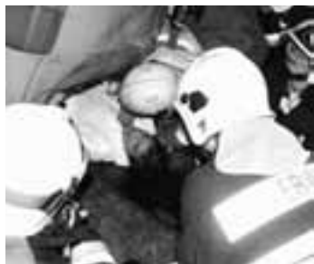
Der Patient wird mit dem Rettungsbrett geborgen

zeug für eine möglichst einfache Bergung des Patienten vorbereitet. Zuerst wurde in diesem Fall die Beifahrertüre entfernt, anschliessend die B-Säule herausgetrennt. Der Sicherungstrupp stützte währenddessen das ganze Fahrzeug damit das Dach nicht einbrach. Ca. 30 Minuten nach dem Alarm war der Patient im Ambulanzfahrzeug eingeladen und konnte ins Spital Olten gebracht werden. Es zeigte sich erneut, dass nur durch praktisches, realistisches Üben die auftretenden Probleme gelöst werden können. Und dadurch bei einem Ernstfall ein professionelles Vorgehen gewährleistet wird. Vielen Dank für das Verständnis, wenn man durch eine Feuerwehrübung einen etwas weiteren Weg unter die Räder nehmen muss.