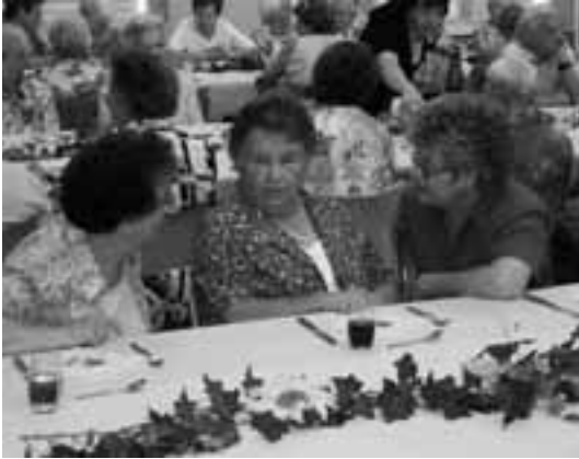
Gespräche bei einem guten Tropfen