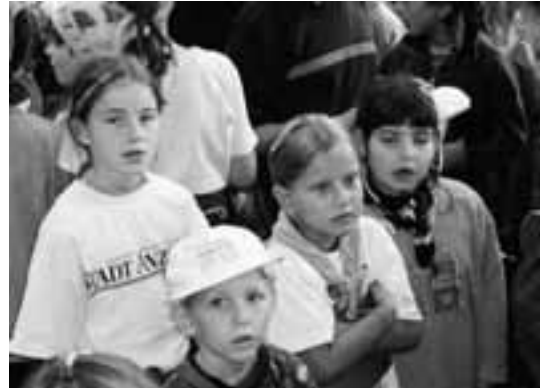
Das war ein anstrengender Tag