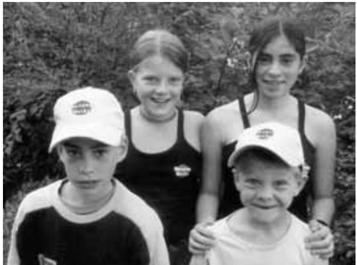
Die vier Kinder mit den guten Ideen