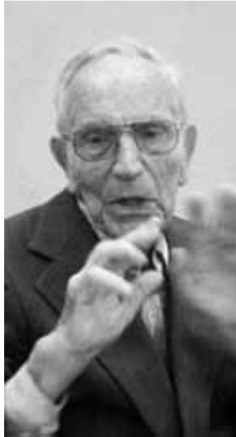
93 Jahre und voller Energie