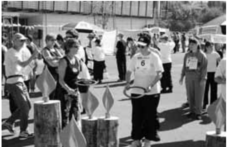
Hier darf man sich die Finger nicht verbrennen

Das Würfeln, ein absolutes Glücksspiel, hat schon so manchem Sportler zu einem besseren Rang verholpen, falls ein Sechser gewürfelt wurde und die Punkte entsprechend eingeholmt wurden.