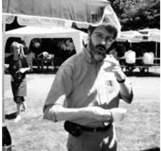
«Gut, dass du mich einmal mit einem Kaffee erwischst! Bisher war es immer mit einer Flasche Bier», meinte unser Pfarrer bei der Aufnahme.