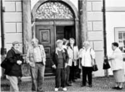
Interessanter Besuch des Klosters Engelberg

Die Uhr zeigte bald halb fünf, es hiess Abschied nehmen von diesem schönen Flecklein der Schweiz. Damit die Heimreise etwas angenehmer und vor allem