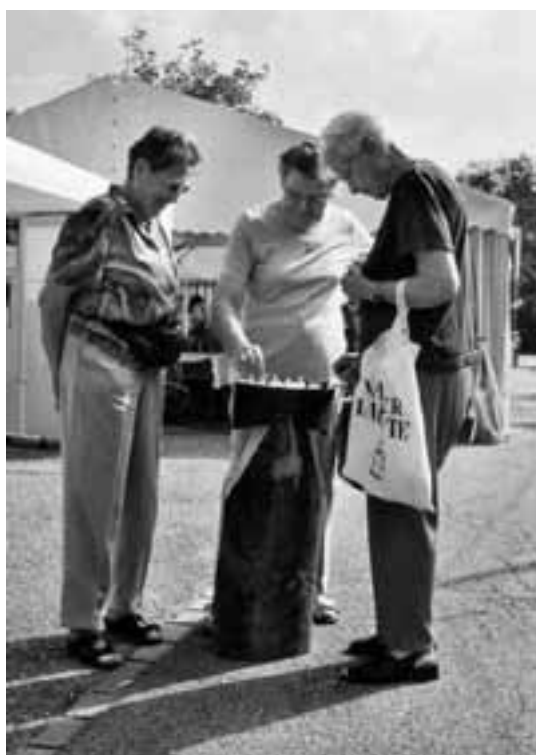
Während die ältere Generation spielte...

Text: Erika Müller