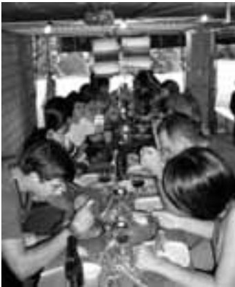
50 Portionen Risotto und Spaghetti wurden verspeist

Braucht es wirklich ein Quartierfest? Sind wir nicht von den vielen Freizeitangeboten überschwemmt? Besteht überhaupt ein Bedürfnis nach einem Quartierfest? Man kennt seine Nachbarn, man sieht sie jeden Tag, muss man auch noch am Abend mit ihnen zusammensitzen? Da muss man noch Material organisieren und eventuell noch seine Garage zur Verfügung stellen.