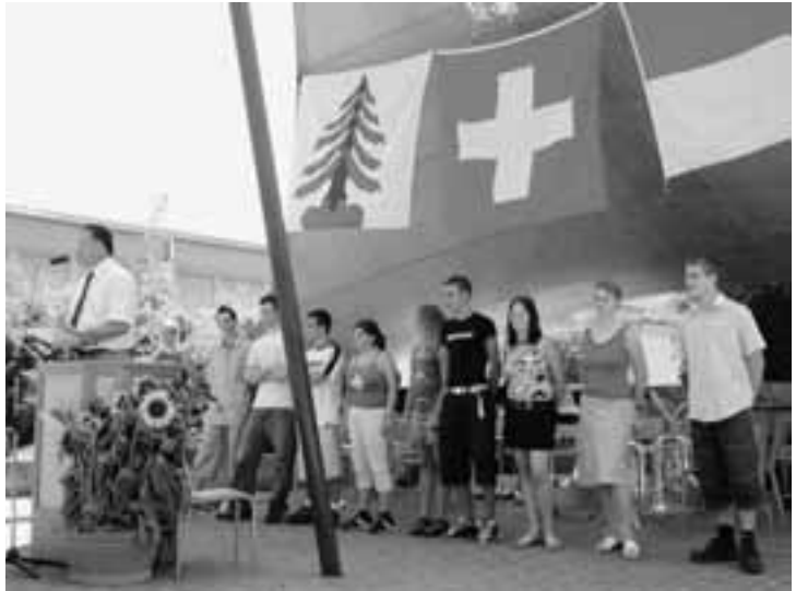
Ich gelobe es