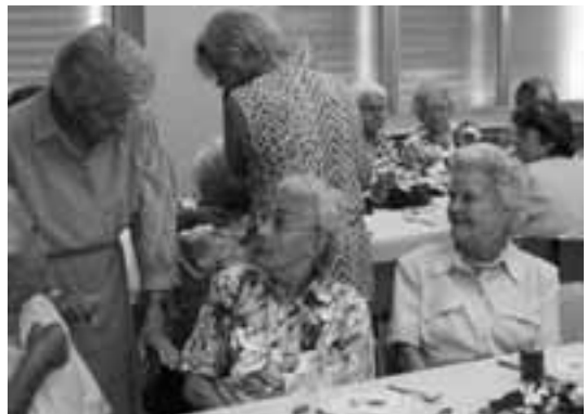
Kommst du nächstes Mal auch wieder?