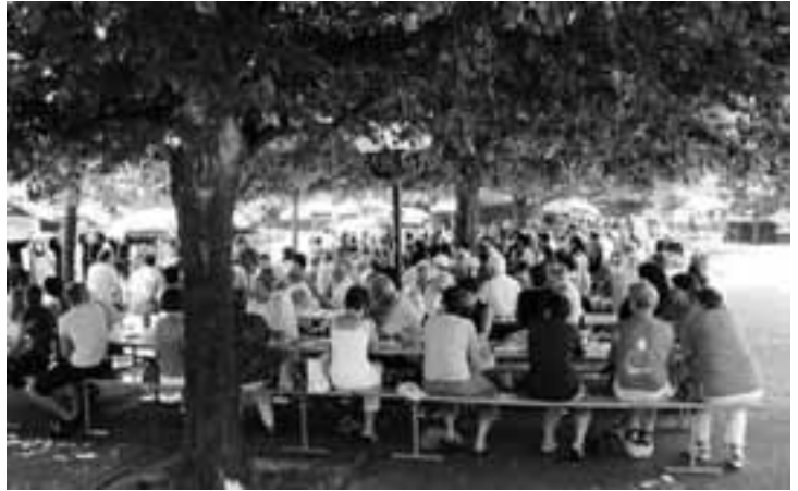
Zahlreiche Besucher unter den Linden