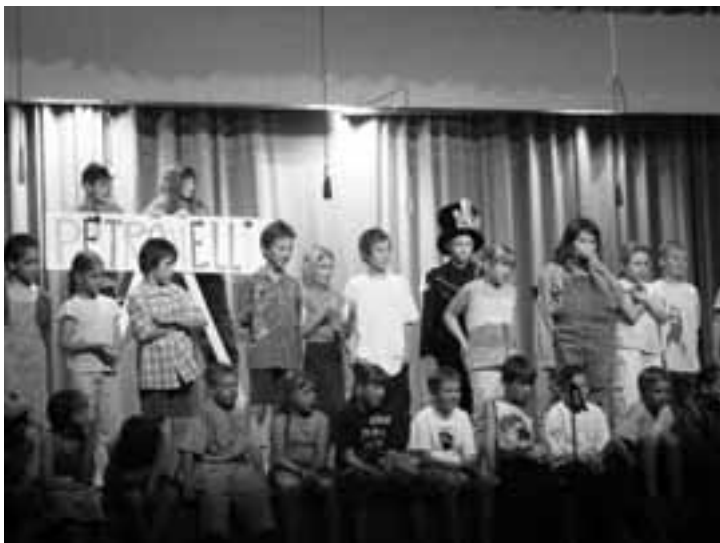
Zirkus Petronelli in Aktion