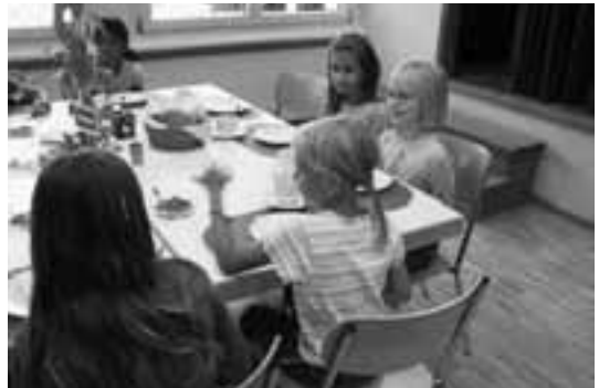
Das Zmorge stösst auf Begeisterung