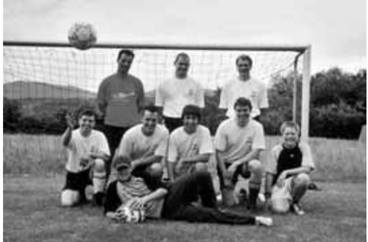
Erfolgreiche Mannschaft am Grümpeltturnier

Der Jugiparcours am Beizlifest war ein grosser Erfolg. Durch die Grasteilnahme versuchten die Jugendlichen unermüdlich, immer wieder ihre Bestzeiten zu unterbieten. Ein gewisser Werbeeffect konnte durch einige neue Mitglieder der Jugendriege bereits erzielt werden. Dieser Effekt bezog sich bisher aber vor allem auf die jüngeren Jahrgänge. Da zudem viele Mitglieder der grossen Jugi den Übertritt in den Turnverein in An-