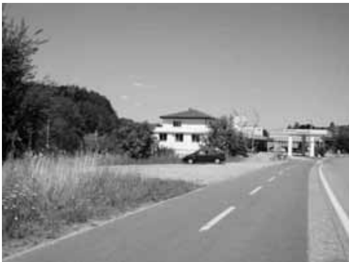
Zufahrt zu den Parkplätzen beim Bally-Park

Nach der Zustimmung aller Gemeinderäte gilt es jetzt noch Detailfragen zu klären. Schliesslich wird dann das Projekt den Ge-