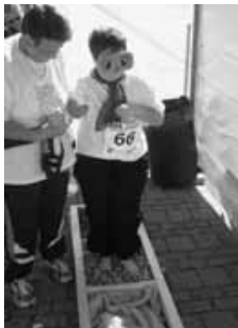
Wie heisst das Ding das in der Flasche steckt?

Einmal selber wie ein Clown auszusehen, nämlich perfekt geschminkt zu sein, dazu war auch in diesem Jahr Gelegenheit geboten. Konnte man sich doch einfach in einem dafür vorgesehenen Stuhl setzen, und flinke