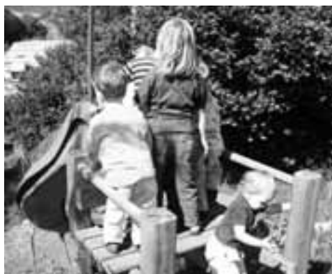
Auf der Rutschbahn

Hallo, ich bin drei Jahre alt und wohne in Gretzenbach. Einmal im Monat gehe ich mit meinem Mami und meinem kleinen Bruder in den Fröschliträff. Ich freue mich jedes Mal darauf, weil es dort noch viele andere Kinder hat. Wir spielen zusammen mit den vielen Spielsachen, rennen herum oder können auch etwas basteln. Wir haben schon mal Steine angemalt, zum Glück hatten wir eine Schürze an. Mami wollte nämlich nicht alle Kleider neu waschen. Gut gefallen hat es mir auch, als wir Grittibenzen gebacken haben. Da durfte zuhause auch der Papi davon essen. Bei schönem Wetter können wir auch draussen sein, das Römerbad erkunden und auf dem Spielplatz die grosse Rutschbahn und das Ritiselli benutzen. Das gibt natürlich Hunger, aber es hat ja im Fröschliträff immer Chrömli und etwas zu trinken für uns alle. Mami hat gesagt, dass