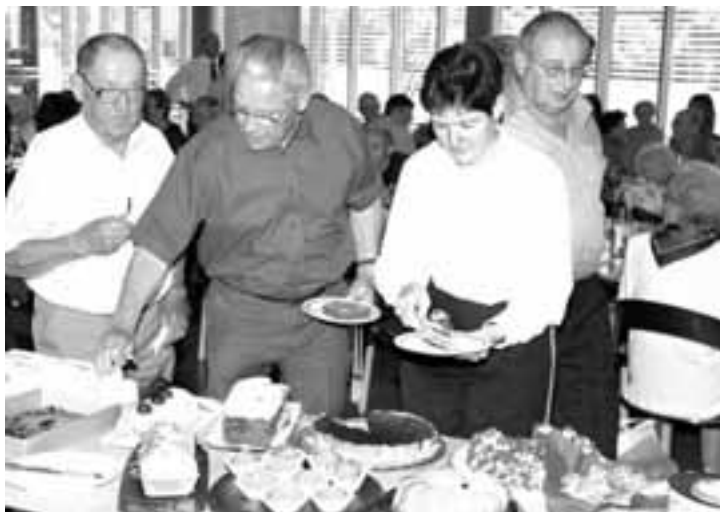
Die selbstgemachten Kuchen und Torten fanden reissenden Absatz