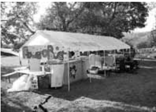
Die etwas andere Bar