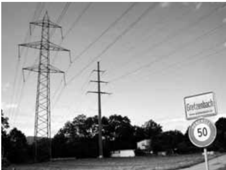
Strom für Gretzenbach

Die Finanzkommission hat Bedenken, ob ihr Auftrag in der vorgegebenen Zeit überhaupt seriös durchführbar sei. Sie schreibt in