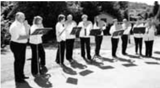
Open-Air-Zugabe: Das Ensemble der Panflötenschule Dajoeri