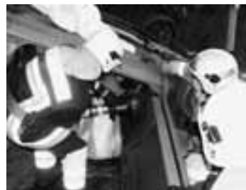
Heraustrennen der Türe

Der Sicherungstrupp war für die Stabilisierung des Fahrzeugs verantwortlich, damit der Befreiungstrupp mit dem Spreizer und Schneider den Patienten freilegen konnte. Der Betreuungstrupp arbeitete eng mit der Ambulanz zusammen. Zuerst wurde der Patient durch die Sanität stabilisiert. Diese Stabilisation ist wichtig, damit die Bergung nicht unter zu grossem Zeitdruck steht und der Patient nicht noch mehr verletzt wird. Anschliessend wurde das Fahr-