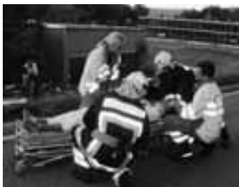
Optimal versorgter Patient

Diese Meldung war auf dem Pager der Stützpunktfeuerwehr Schönenwerd. Mit Blaulicht und Sirene rückte die Alarmgruppe 5 sofort aus. Kurz ausserhalb von Schönenwerd, Richtung Olten, hatte sich ein Auto überschlagen und war in Brand geraten und ein Mofafahrer lag schwer verletzt am Strassenrand. Sofort wurde die Strasse gesperrt, um weitere Unfälle zu vermeiden. Gleichzeitig wurde mit dem Schnellangriff aus dem Tanklöschfahrzeug das Feuer beim Fahrzeug gelöscht. Inzwischen war auch die Ambulanz eingetroffen und versorgte als Erstes den verunglückten Mopedfahrer. Währenddessen bildete die Feuerwehr 3 Trupps für die Bergung des Fahrers im verunglückten Fahrzeug.