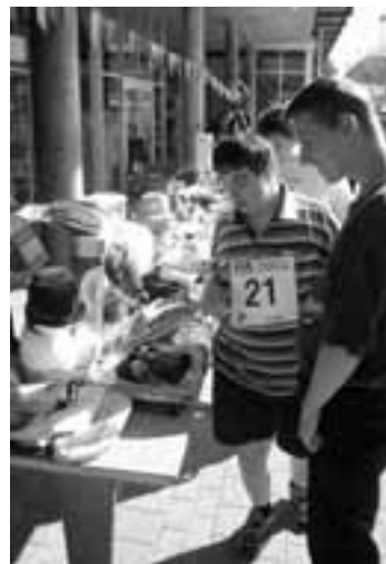
Hier hat es schöne Sachen

Die Zeit rückte erbarmungslos voran, und schon hiess es «Rangverkündigung». Dank unseren