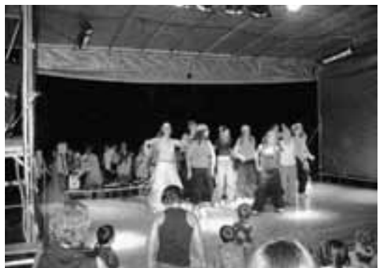
Bretter, die die Welt bedeuten