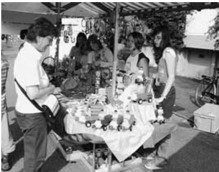
Viel Lob für unseren Einsatz