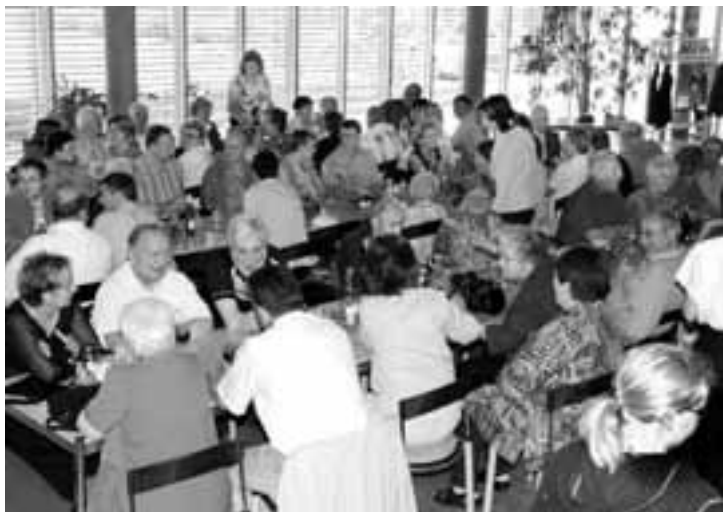
Dankbare Zuhörerinnen und Zuhörer am Jubiläumskonzert

Kant. Musikfest von Langendorf organisiert. Der Musikverein machte an diesem Konzert mit und spielte vor den Experten das Programm, welches in Langendorf zu absolvieren war. Am Sonntagmorgen wurde das Aufgabestück des Kantonalen Musikfestes «Spiritual Moments» vorgetragen. In der anschliessenden aufbauenden und sehr guten Kritik erklärte uns der Experte, wo noch gefeilt werden kann für den Vortrag in Langendorf. Kurz vor Mittag musste zum Marschmusikvortrag eingestanden werden. Das Ziel war es, den Podestplatz zu erreichen, trotz dem Mitmachen von auswärtigen Musikgesellschaften. Als letzter Verein wurde «Flott voran» vorgetragen, und die Messlatte mit über 90 Punkten war hoch angesetzt. Doch welcher Jubel, als der Speaker die Punktzahl 91.5 bekanntgab, und somit Gretzenbach als