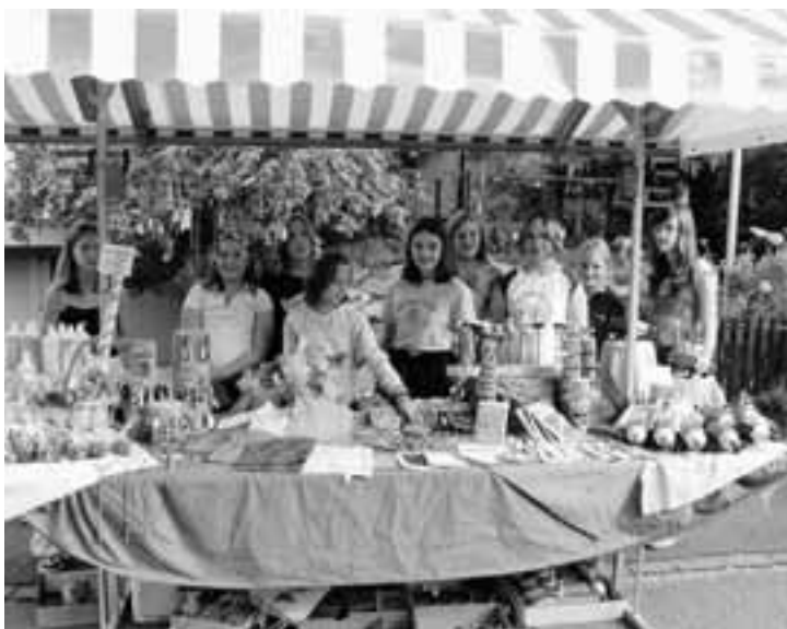
Kundschaft wird erwartet