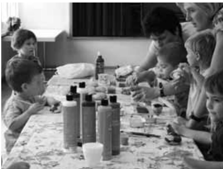
Beim Steine anmalen

ich im Fröschli auch von den anderen Kindern lernen kann. Ich habe nämlich gesehen, wie ein anderes Kind aufs WC gegangen ist. Das mache ich jetzt manchmal auch, aber nur wenn ich Lust dazu habe. Meinen Bruder muss Mami sowieso noch wickeln, aber dafür hat es ja auch ein Wickelkissen. Bevor wir nach Hause gehen, helfen wir noch beim Aufräumen mit, und nachher wird's dann wieder ruhig im Römersaal. Hmm, einmal mussten mein Mami und Papi am Abend