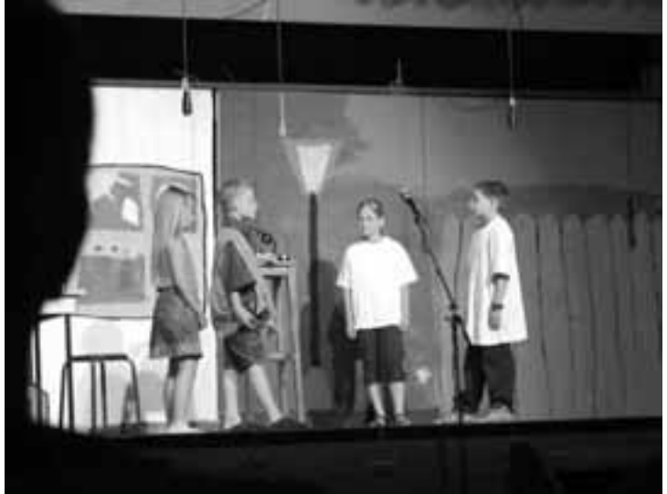
Impression aus dem Musical

«Werken, basteln, malen und vieles mehr, die Projektwoche war einfach toll. Ich habe gerne bei den Kulissen mitgeholfen. Am Abend vor der Aufführung war ich schon ein bisschen aufgereg.