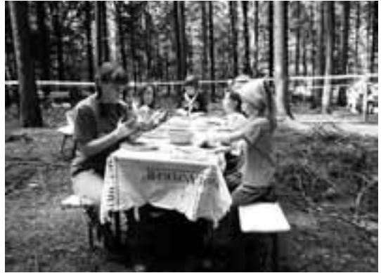
Dreckige Finger machen auch Spass