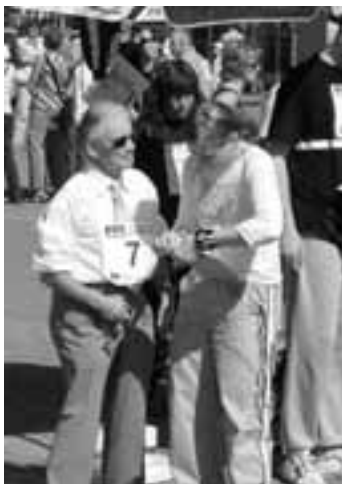
Was genau muss ich jetzt machen?

Hände machten aus dem Gesicht ein Meisterwerk.