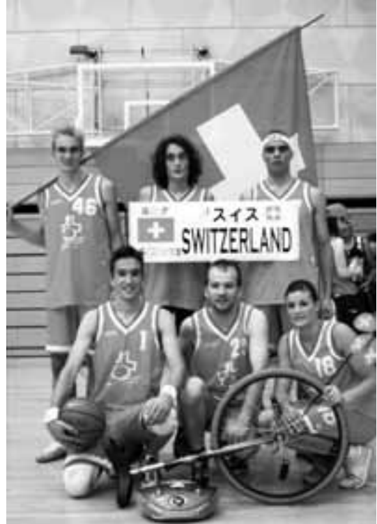
Swiss Basketball Team

Die nächste Weltmeisterschaft im Jahr 2006 wird übrigens in der Schweiz (in Langenthal) ausge-