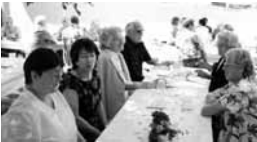
Was hier so alles verhandelt wird ...