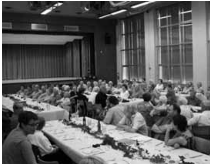
Über 8000 Jahre Lebenserfahrung versammelten sich in der Turnhalle.