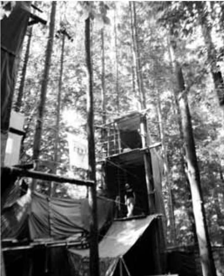
Erlebniswelt der Cevi

Hier konnte man sich Bänder ins Haar flechten lassen, aus Speckstein Schmuckstücke feilen, Perlenketten aufreihen, Speere schnitzen, Briefe schreiben und anderes mehr tun.