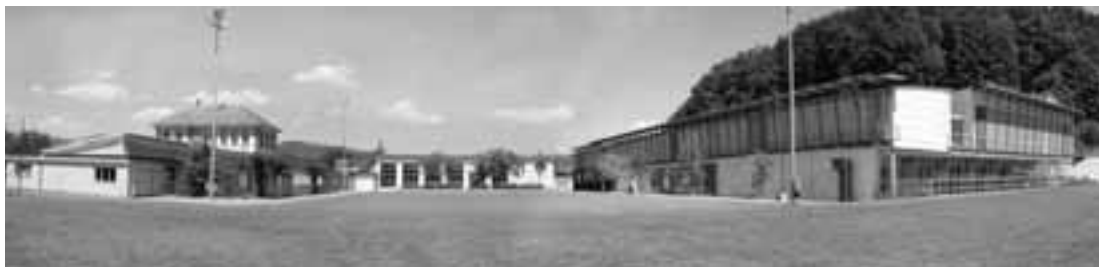
Panoramaansicht der Schulen