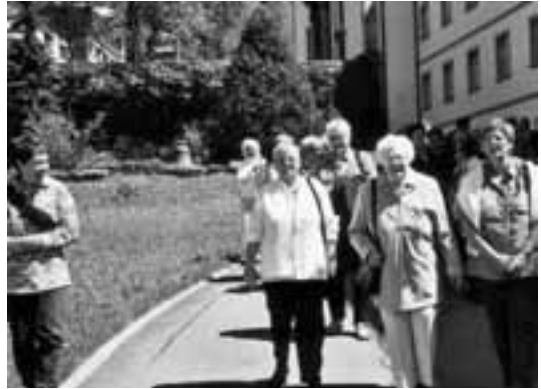
Besichtigung bei herrlichem Wetter

Die Uhr zeigte bald halb fünf, es hiess Abschied nehmen von diesem schönen Flecklein der Schweiz. Damit die Heimreise etwas angenehmer und vor allem