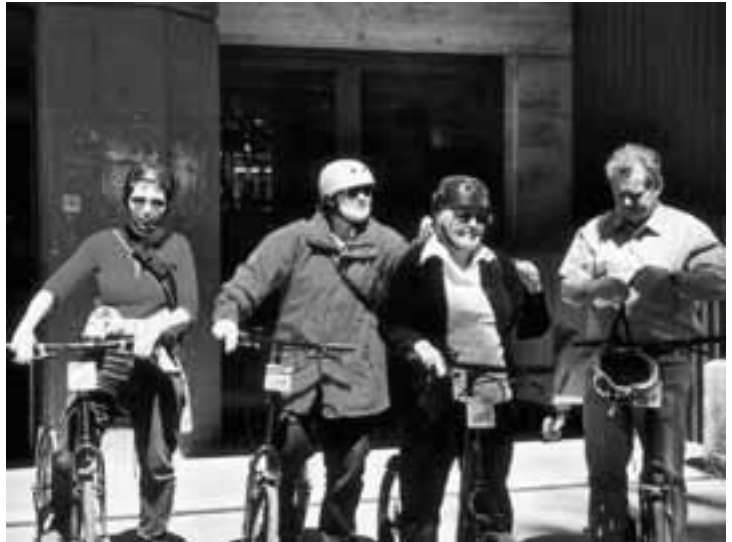
Gut geschützt für die rasante Talfahrt mit dem Trotti.

Langsam meldete sich der Magen, war es doch in der Zwi-