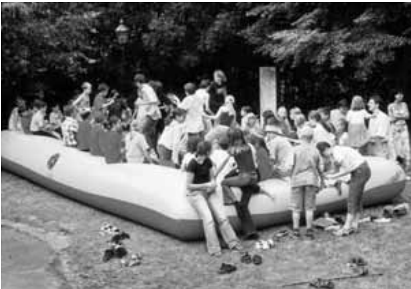
Grossandrang auf der Gumpimatte

Das Fest der Gretzenbacher Kirchenpatrone (= Schutzheilige) Peter und Paul fand dieses Jahr am Sonntag, 27. Juni 2004, statt und stand unter dem Motto «Seilschaft». Ob als Zweitklässler oder auf einer Bergtour: anschaulich wurde in der Kirche vorgeführt, wie wichtig es ist, für einander da zu sein und einander zu helfen!