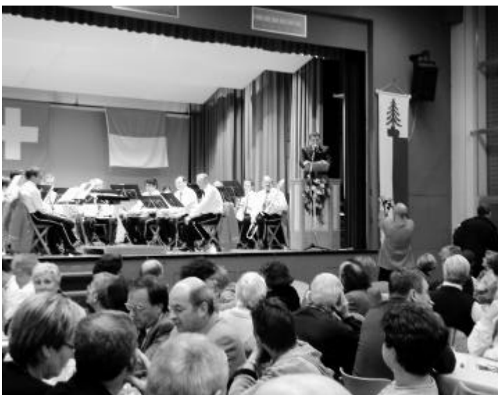
Musikverein Gretzenbach umrahmte die Feier

Er habe sich durch persönlichen Einsatz dieses Amt erarbeitet. Aus seiner Zusammenarbeit im Gemeinderat hat der neue Nationalrat die Initiative und den Willen, etwas zu verändern, geschätzt. Er habe aber bald bemerkt, dass es in Gretzenbach nicht so viel zu ändern gibt. Diese Grundeinstellung habe ihn auch bald in den Kantonsrat geführt. Politisch kann