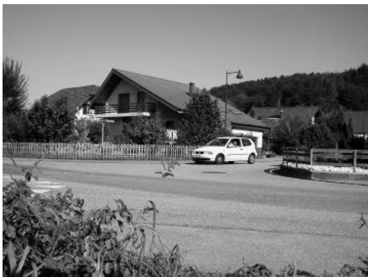
Generell Rechtsvortritt auf der Bielackerstrasse: Kreuzung mit Pfarrmattstrasse und Sängetelmatten

Die Bielackerstrasse soll vor allem dem Erschliessungsverkehr und nicht dem Durchgangs- und Umgehungsverkehr dienen. Aus diesem Grunde waren im Teil Schulanlagen bis Pfarrmattstrasse bereits wechselseitige Parkflächen zur Verkehrsberuhigung aufgenommen worden. Als weitere Massnahmen soll nun durchgehend