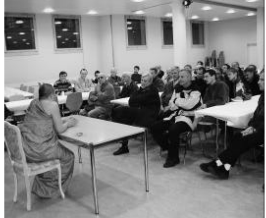
Der Abt hat seine Zuhörer in den Bann gezogen

Religion mobilisierte eine stattliche Schar interessierter Männer aller Altersklassen. Nach einem sehr interessanten Rundgang durch die Anlage stand ein Treffen mit dem Abt auf dem Programm. Dieser gab sich sehr offen und beantwortete sämtliche Fra-