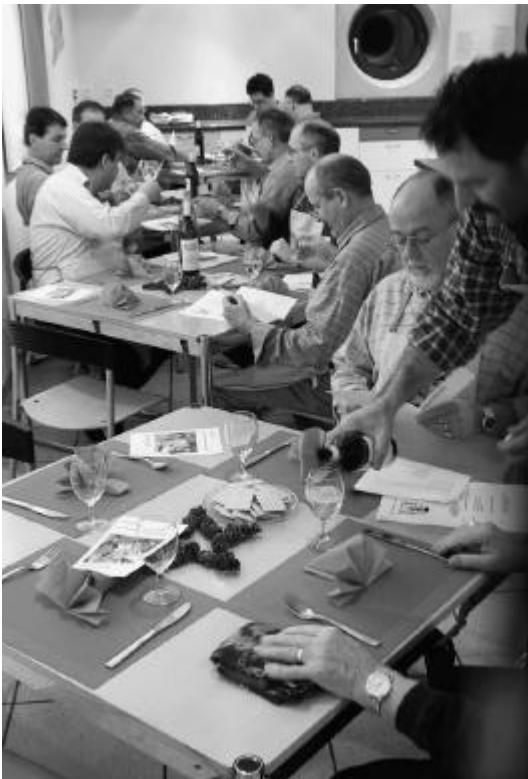
Der Tisch ist gedeckt

Doch Dessertpanne hei fasch Tradition Gueti Rezäpt ändere nüt a dr Situation Denn erschtens muesch läse und verstoh D'Zyte und Mängene ihalte derno Doch d'Manne nämes nid immer so gnau Näme Wermueth statt Cognac, mir kenne dä Fau 1 oder 2 Stund im Chüelschrank lo stoh do schreit i dere Chuchi kei Hahn derno.