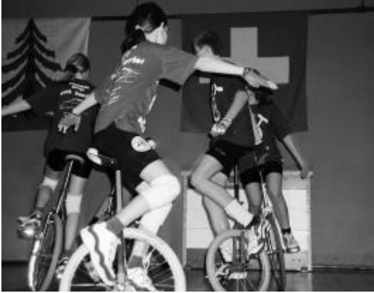
Einrad-Club Gretzenbach in voller Aktion