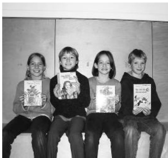
Die glücklichen Gewinner