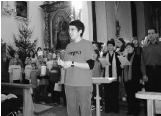
Calypsochor und ...