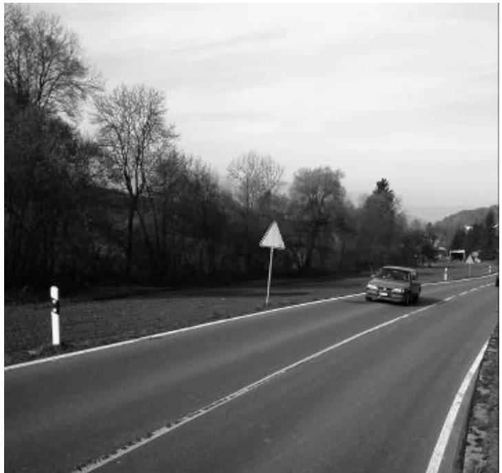
Altes Anliegen realisieren: Fuss- und Radweg äussere Weid (entlang dem Dorfbach am linken Bildrand)

Die Fernsteuerung der Wasserversorgung ist veraltet und Ersatzteile sind kaum mehr zu beschaffen. Zudem fehlen wichtige Messwerte. So können beispielsweise grosse Wasserverluste (Leitungsbrüche) nicht schnell genug festgestellt werden, wenn das Wasser nicht oberflächlich austritt. Für 220 000 Franken soll die