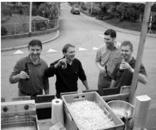
Am Schluss waren es 56 Kilo Pommes frites