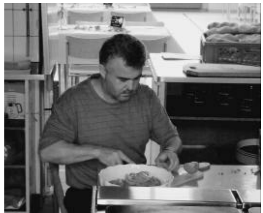
Der Maître de Salade