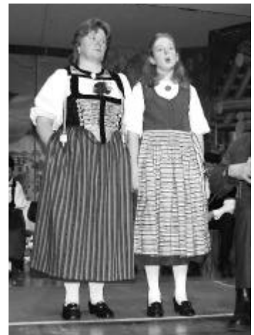
Mutter und Tochter