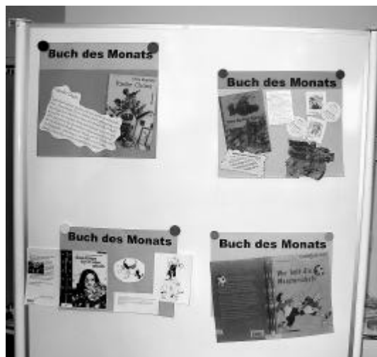
Beschreibung der verschiedenen Bücher