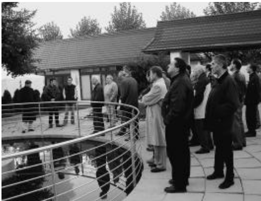
Interessiert lauschen sie den Ausführungen