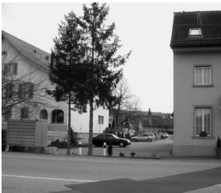
Gartenwirtschaft zwischen Bar (rechts) und Mehrfamilienhaus?

Sie schilderten intensive und wiederholte Nachtlärmbelästigungen aus dem Betrieb der Bar und befürchteten eine Verschlimmerung der Situation durch eine zusätzliche Gartenwirtschaft. Die Bau-