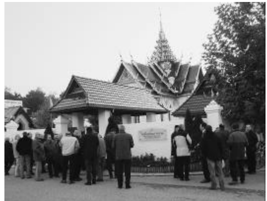
Das Buddhistische Zentrum als Besuchermagnet