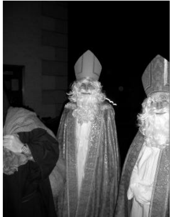
Beim Aussenden vor der Kirche