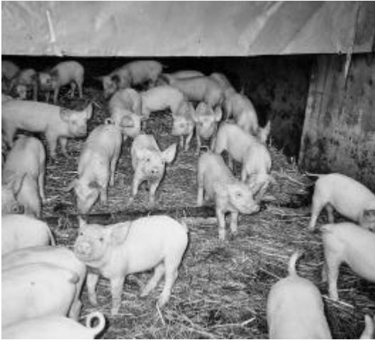
Eine grosse Schweinerei

Nun gings in den Stall. Die Kinder gaben den Schafen Heu und streichelten über das fettige Fell. Man muss ruhig sein, sonst erschrecken die Tiere! Zum Entzücken der Kinder gab es da drei Lämmer, die ohne Mutter aufwachsen. Was für ein Gefühl, ein