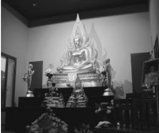
Der Buddha im Zentrum

Nach einem Unterbruch wurden die bereits zur Tradition gewordenen ökumenischen Männeranlässe im Oktober mit einem Besuch des Buddhistischen Zentrums Gretzenbach fortgesetzt. Die den meisten unbekannte und nun in unserem Dorf ansässige