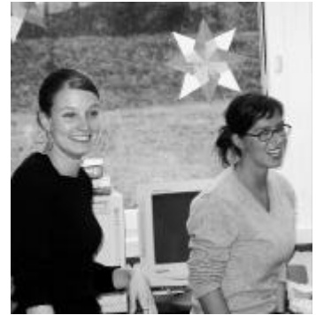
Aufgestellte Praktikantinnen aus der Westschweiz

Unter vielen anderen Erlebnissen heben die Studentinnen und Studenten eine Stadtführung in Aarau hervor. Voller Stolz erzählen sie auch von einem Lehrerinnen- und Lehrer-Nachessen, bei dem sie tatkräftig bei Coq au vin und