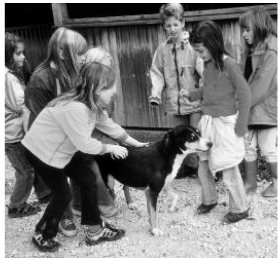
Jetzt wird es doch etwas zuviel