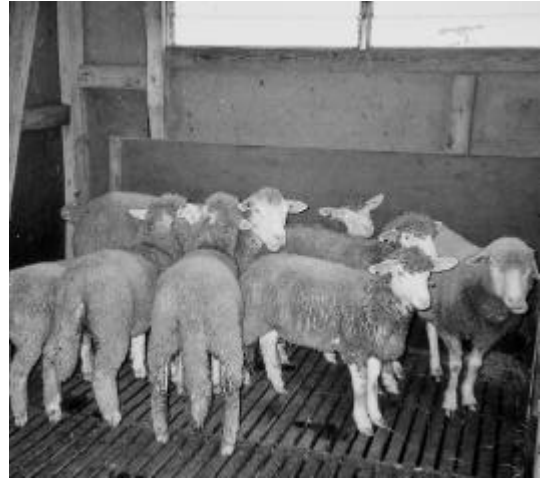
Sind die allerliebste

Nun gings in den Stall. Die Kinder gaben den Schafen Heu und streichelten über das fettige Fell. Man muss ruhig sein, sonst erschrecken die Tiere! Zum Entzücken der Kinder gab es da drei Lämmer, die ohne Mutter aufwachsen. Was für ein Gefühl, ein