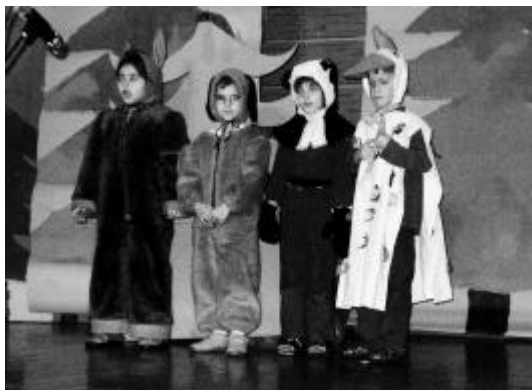
Die 4 Musikanten

Am 15. Januar war es endlich soweit: 50 Kinder aus allen drei Kindergärten führten das Märchen «Die Bremer Stadtmusikanten» in der alten Turnhalle auf. Dabei begeisterten sie Gross und Klein gleichermaßen. 4 Wochen lang beschäftigten sich die Kinder intensiv mit der Geschichte der 4 Tiere, die von ihren Besitzern verstossen