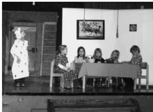
Die grosse Diskussion am Tisch