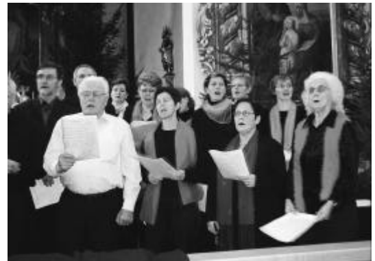
... Kirchenchor vereint