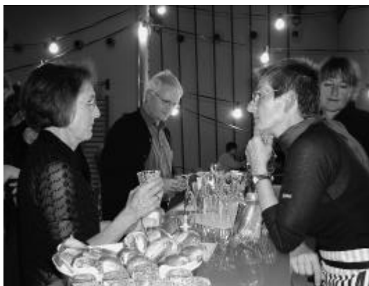
Gespräche neben dem Konzert