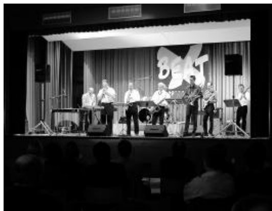
Just The Band