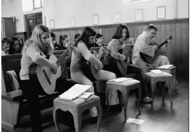
Text und Foto: Daniel Fahrni

Für die musikalische Begleitung dieses besinnlichen Anlasses sorgte ein Gitarrenquartett mit Ernst Knorr.