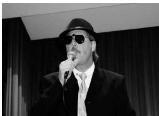
The Blues Brothers

Am letzten Oktobertag gastierte auf Einladung des «dr Gretzebacher» sowie als Kulturengagement des Kantons Solothurn die in der Region Olten bekannte Band Crossbeat in der alten Turnhalle Gretzenbach.