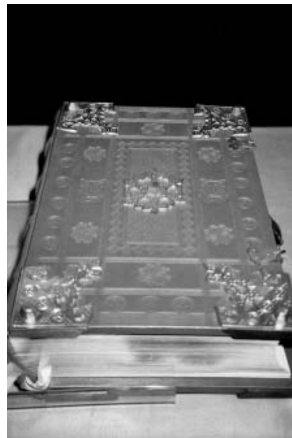
Jahr der Bibel: Exemplar Kirche Gretzenbach

Die Jahresrechnung der Römisch-katholischen Kirchgemeinde Gretzenbach-Däniken verzeichnete für 2002 bei einem Aufwand von Fr. 747'145 und Einnahmen von Fr. 825'089 einen Überschuss von Fr. 77'144. Trotz Mehrausgaben beim baulichen Unterhalt konnte das gute Ergebnis wegen höheren Steuereingängen und Zahlungen aus dem Finanzausgleich erzielt werden.