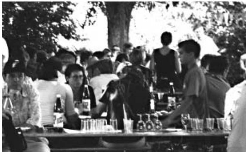
Ihre Fragen sind willkommen!

Im Zusammenhang mit den Religionen, Konfessionen, Ökumene usw. gibt es viele Fragen. Wir veröffentlichen mit dieser Ausgabe eine neue Rubrik. Sie können uns Ihre Fragen stellen, und wir geben sie einer Fachperson zum beantworten. Senden sie das, was sie schon lange wissen wollten,