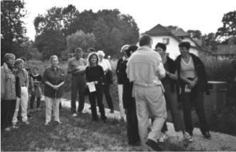
Unterwegs im Täli

zenlos vertraust. Dieser Sohn bleibt dein Geschenk. Und schau rings um das weite Land. Hier werden deine Nachkommen wohnen, in einem Land, in dem Milch und Honig fliesst."